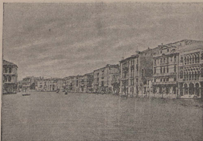
Un carrer de Venècia