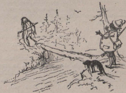
del Real Club Alpinista

Calla, calla, no segueixis; clou ton bech, si, cloulo bé, es precis que te 'n desdeixis y no, tonto, divertexis al que 't va fer presoné.