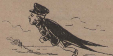
Águila Impostum Contribucionem