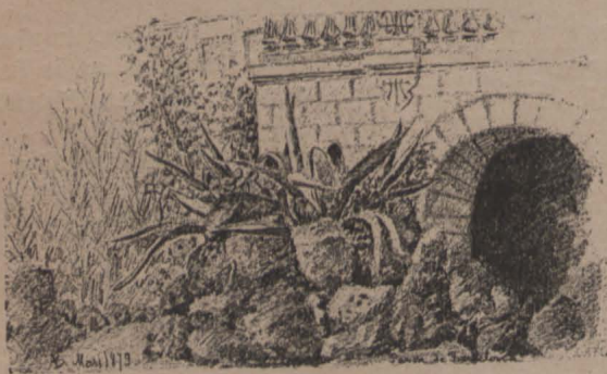
Detall del Parch