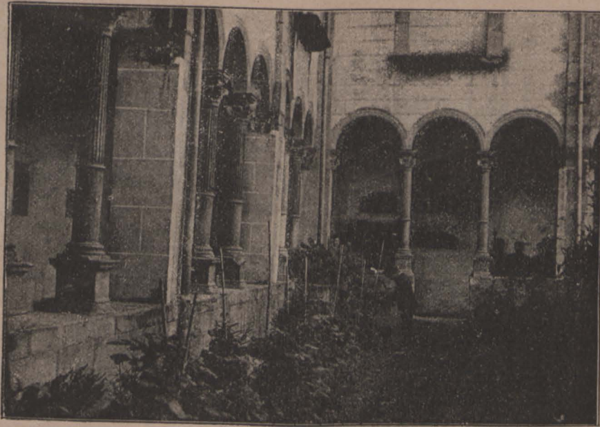
Claustre del monastir de Banyolas

— Ca, no ho vull creurer, — respongué la Lluïsa.