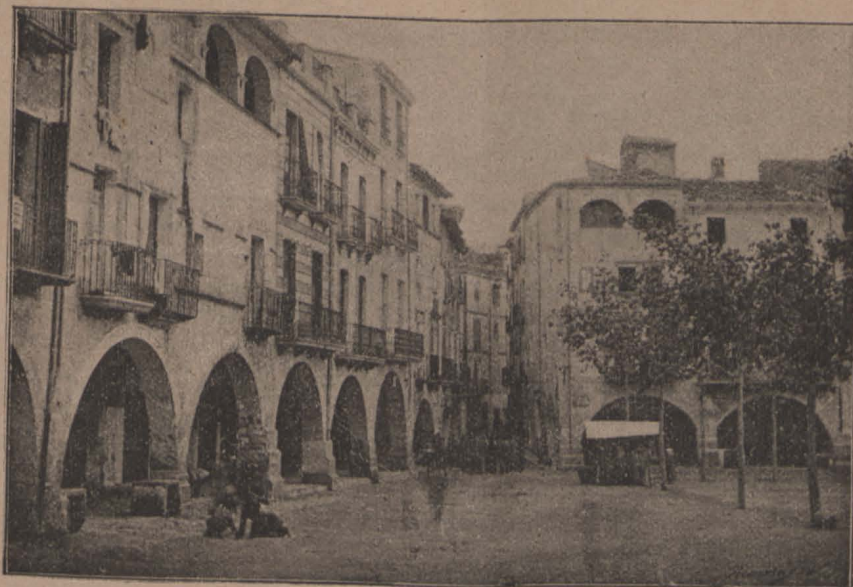
Plassa de Banyolas

En Ricardo se n' en torná cap al pis, tot cantant, demostrant haver recobrat son caracter alegre.