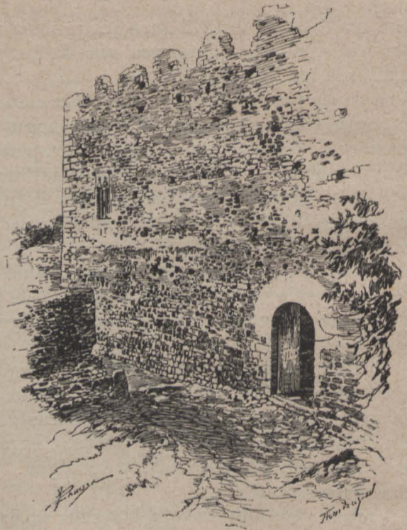
Una entrada del castell de Cardener