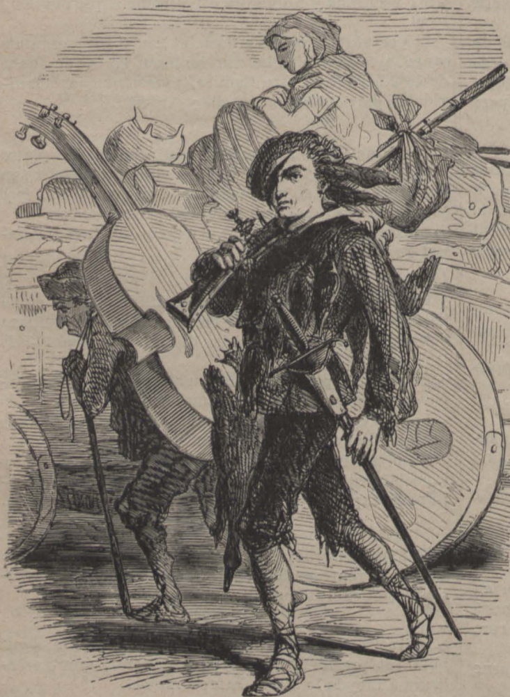
«Cap á un altre poble»