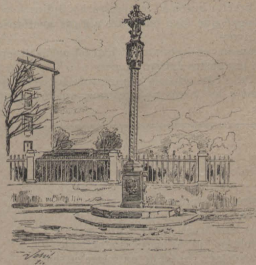
TARRAGONA.—Creu de Sant Antoni