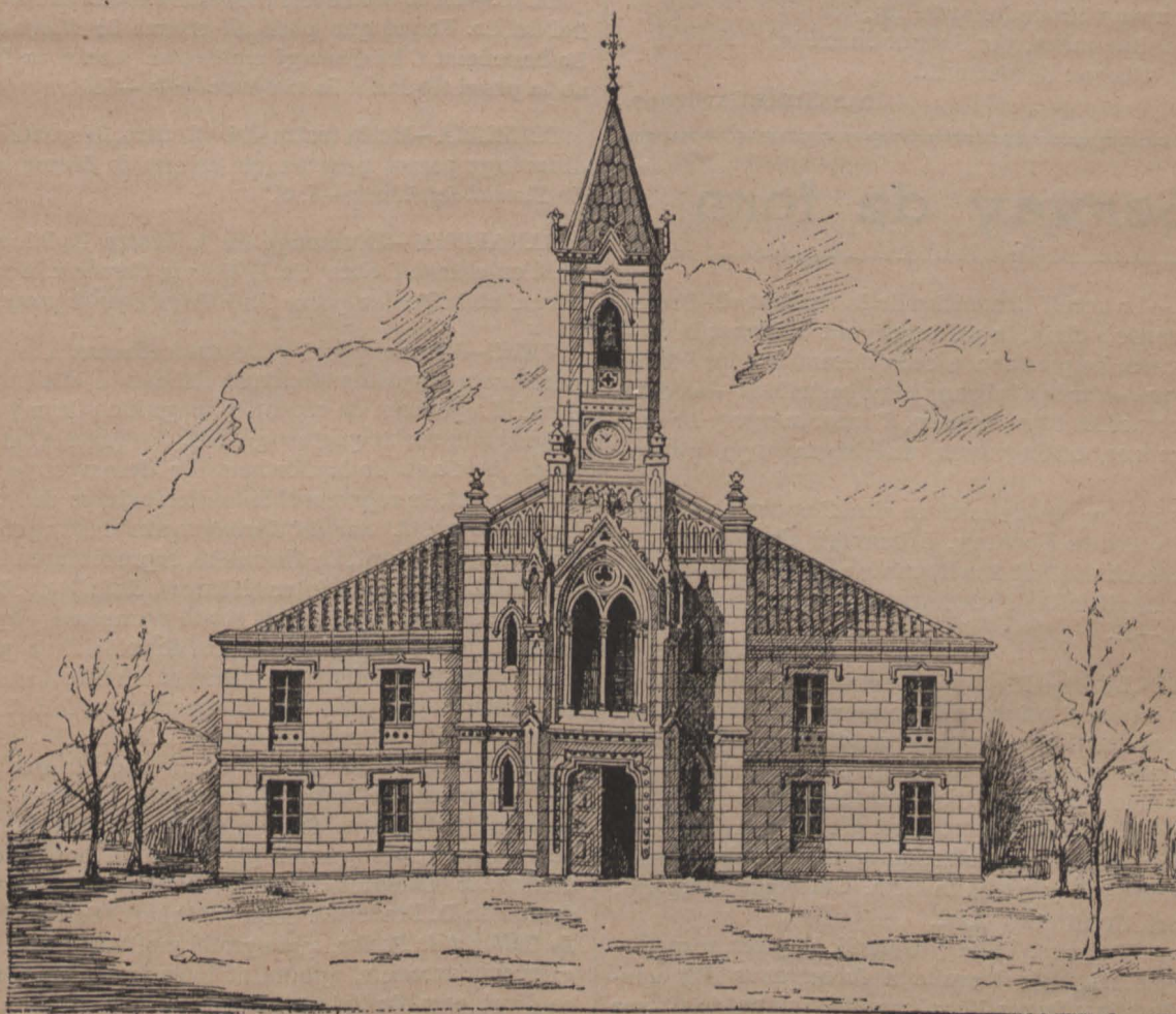
REUS. — Nova fatxada de l' ermita de la Misericordia