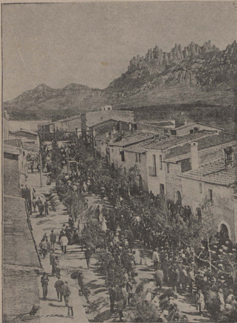
BRUCH. — Festa celebrada en 1893 en commemoració de la gloriosa batalla del 6 de Juny de 1808