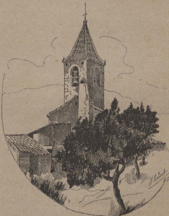
SANT JESÚS DE HORTA