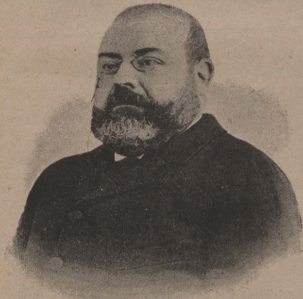
Joseph Fellu y Codina

L'infatigable autor al qual tanta gloria deu lo teatro de casa, y avuy indiscutiblement un dels primers autors de la escena espanyola, en virtut dels justos triomfs lograts per sas obras La Dolorés , Miel de la Alcarria y Marta del Carmen , es á la vegada l'advocat que devant lo Tribunal Suprem defensará la causa del senyor Ximeno, en apelació del fallo donat per la Audiencia de Barcelona.