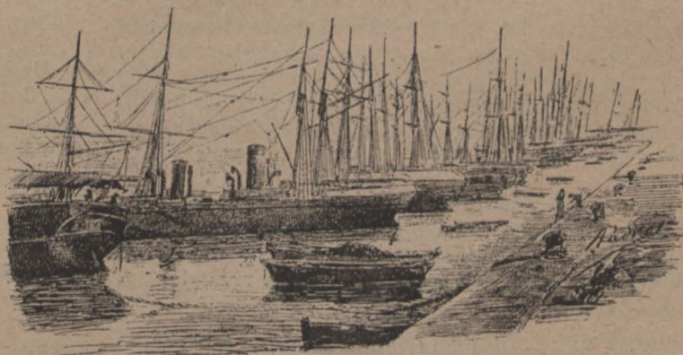
Apunte del Moll del Carbó