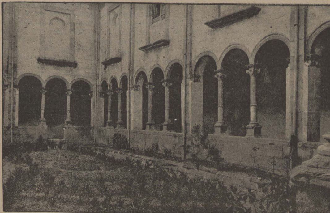
BANYOLAS. — Claustre