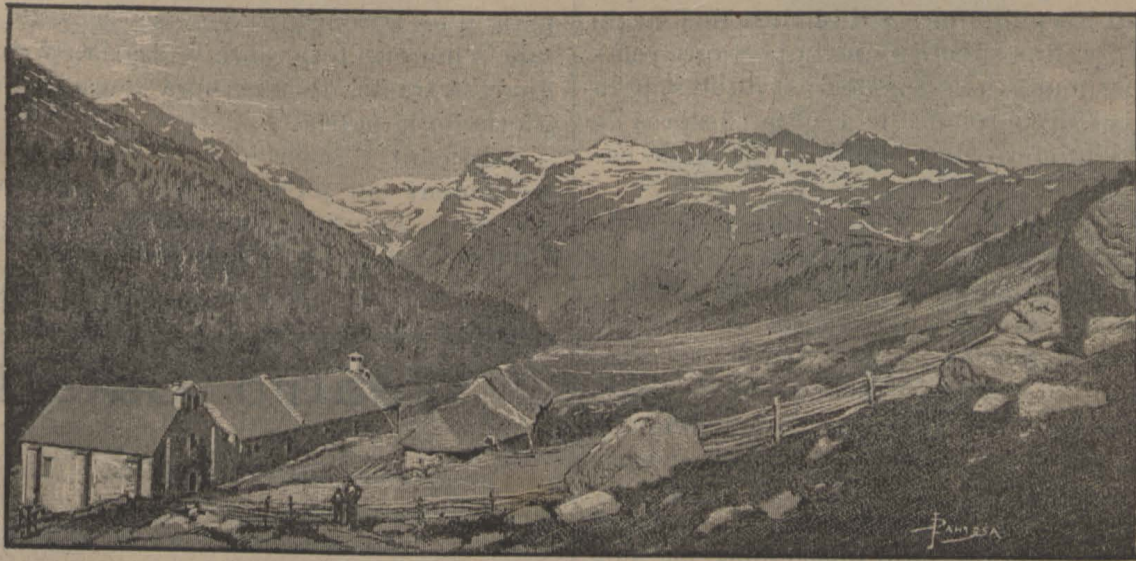
HOSPITAL DE VIELLA (Pirineus catalans)

Com veurán avuy nostres lectors, la present setmana ha sigut abundant á nostra Redacció l'envió de cartas importants. Comensarem per lo tant aquest número ab la present