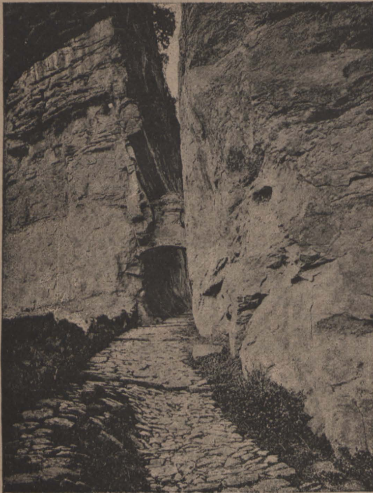
Portal de la rampa del rossinyol