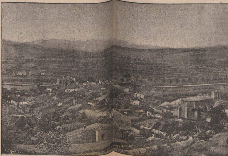
LA ROCA. — Vista General y del Castell

«Escucha, cruel, oye infame, héme aquí en pos de mi honor. No te alejes, no me apartes, que aunque débil mujer soy, vengo á arrojar á tu rostro pedazos del corazón.