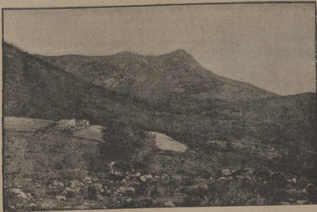
MONTSENY. — La Vall de Santa Fè y Pich de las Aguilas

Es més: fins 'l nom m' han dit del que 'l teu amor aviva: jo no ho crech... pero si arriba á saberho 'l teu marit!