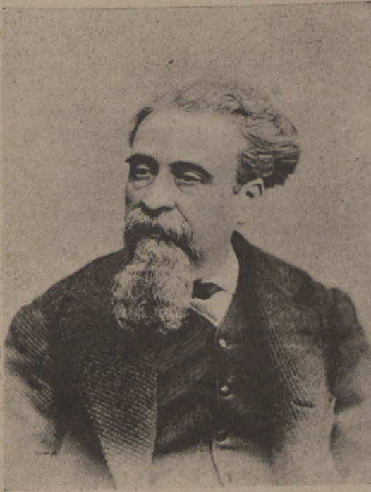
A la edat de 55 anys. — De fotografia