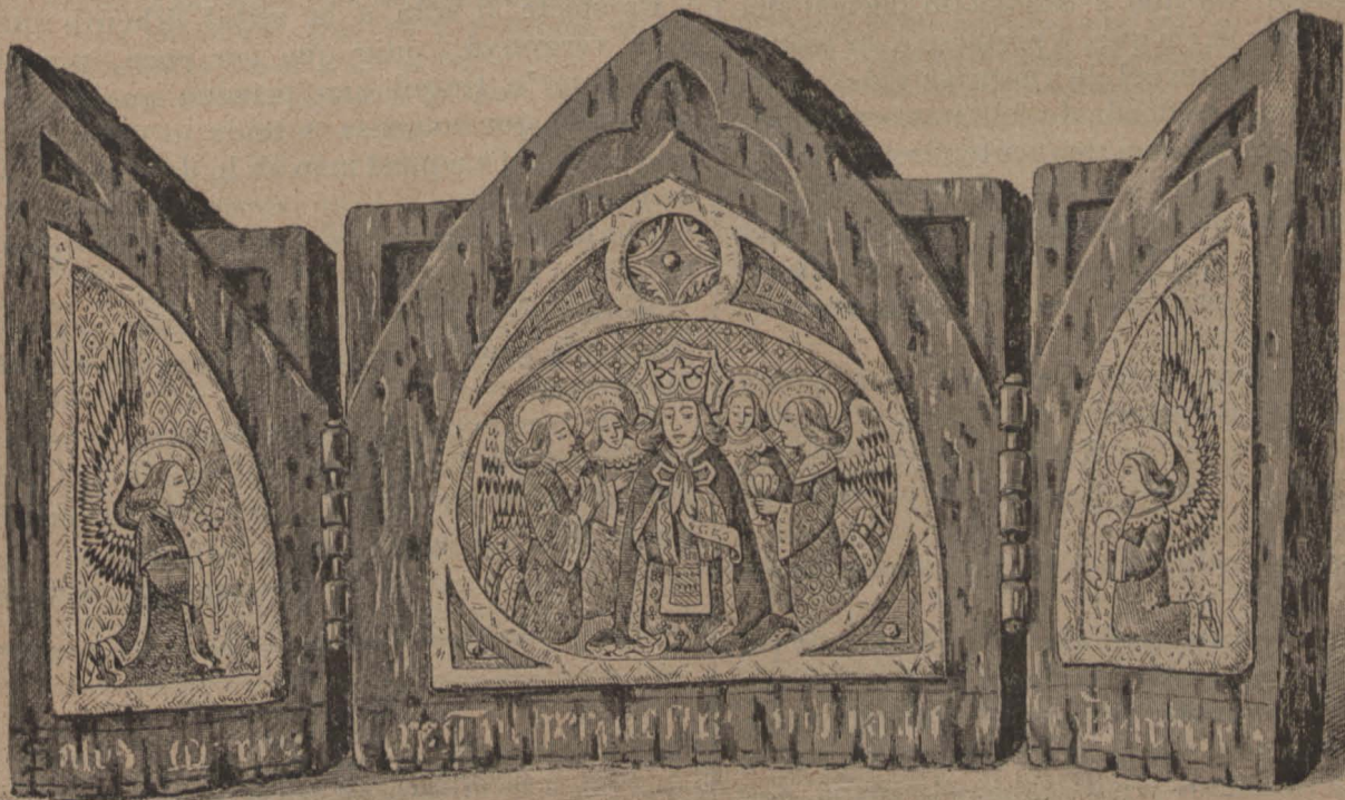
Triptich célebre, existent en un museu particular de Catalunya