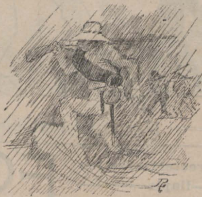
Un dia de pluja