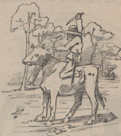
Després de un dia de fam