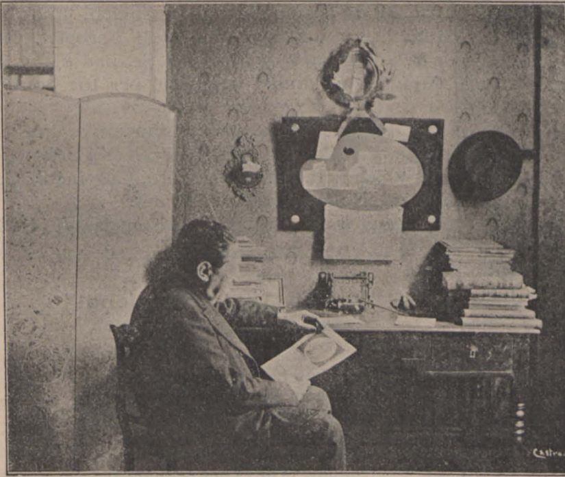
ISCLE SOLER EN SON GABINET D' ESTUDI

d' un' obra dramática que, segons m' han dit, va quedar com nova.