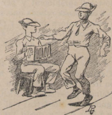
Després de la batalla