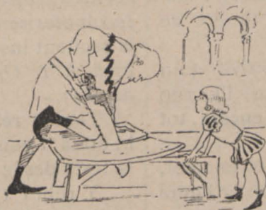
2.—Inventá un inginyós procediment. Després de molt estudiar, va construir un escut de suro.