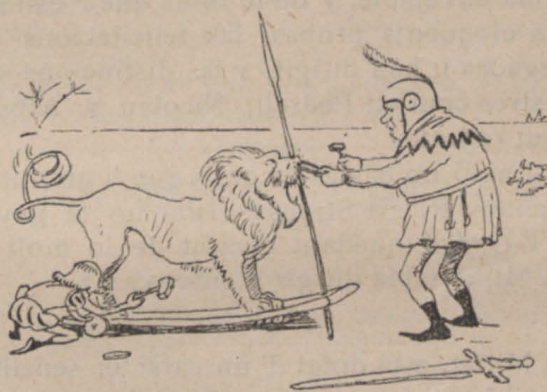
5.—Y clavantli una anella per arrossegarlo...