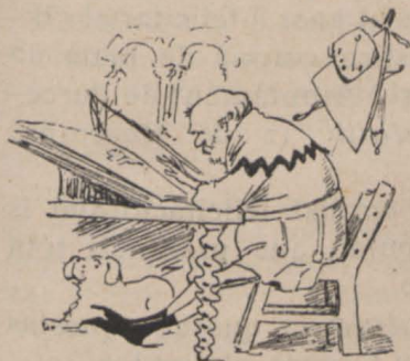
1.—En aquell temps un guerrero molt prudent, desitjant anar á la cassa del lleó...