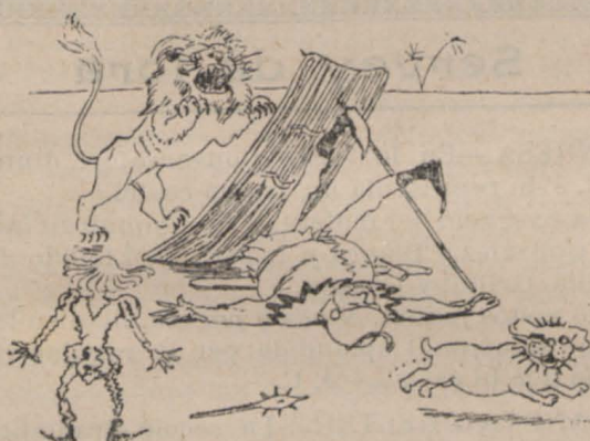
4.—Preparat el guerrero reb á la fiera que clava sos urpas en l' escut de suro quedant aixís presonera.