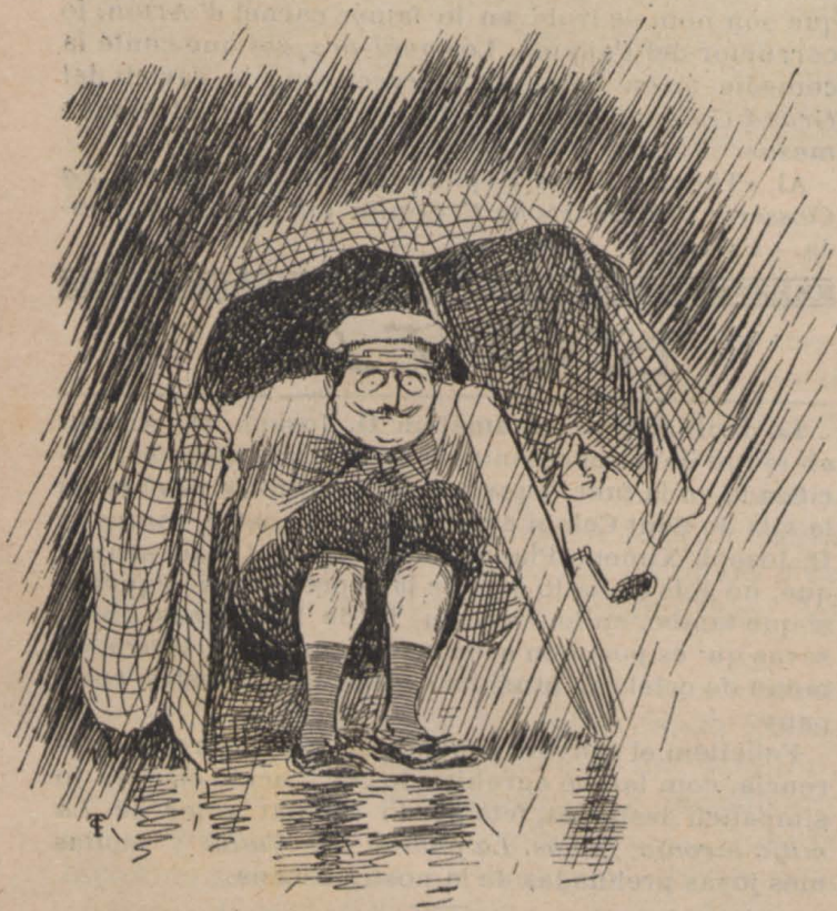
2—Mes una idea salvadora se li presenta, y desligant la man- ta se hi aixepluga dessota.

Abduas revistas 's proposan un fi de gran estima. Fomentar y difundir la llengua catalana y donar traduccions dels mellors treballs estrangers.