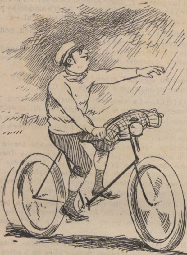
1—En Pepito qu' ha sortir à donar un passeig fora de la ciutat, nota ab espant que comensa à ploure de valent.