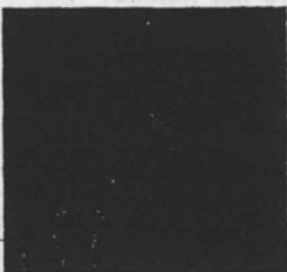
Soldados del Ejército argentino con la bandera de su país en Port Stanley pocas horas después de haber tomado las islas Malvinas.

Los militares no pueden dar marcha atrás sin desdoro gravísimo. El veto británico no puede quedarse con la humillación (sala es la palabra que suena en Londres), de que un país sudamericano le pise la co-