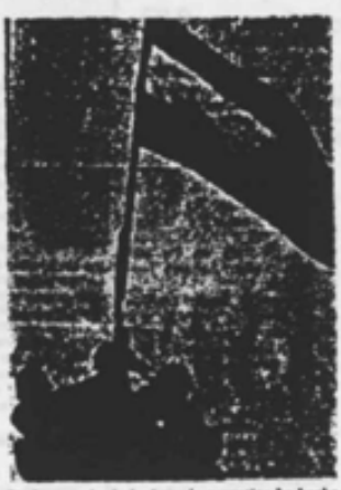
El año pasado de la Armada argentina ha hecho distribuir esta fotografía gratuitamente también en Port Stanley después de que esta Epifanía ocupara las islas Malvinas.

El sistema de gobierno de las Malvinas (Falkland) quedó regulado por la Constitución que entró en vigor el 1 de enero de 1985.