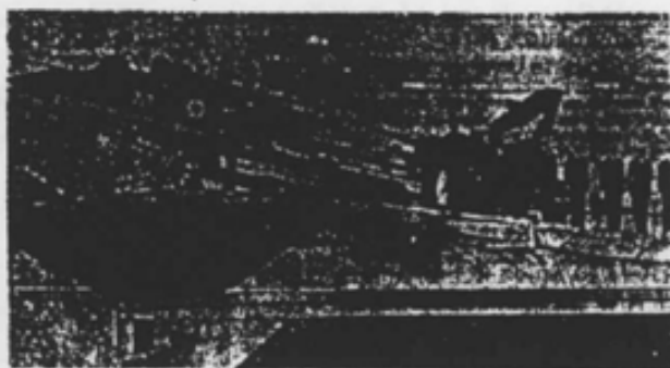
Entre los miembros de la tripulación del avión «Harris» figura el príncipe André, hijo de la reina Isabel II de Inglaterra, que se pide de despedida y que volvió junto a sus compañeros en el portaaviones «Invencible».

La principal dificultad para una acción militar en el archipiélago de las Malvinas reside en la lejanía de cualquier base naval británica (la más cercana, en la isla de Ascensión, se halla a cuatro mil millas). Para la mayoría de la flota argentina las islas se hallan, en cambio, a sólo 730 kilómetros. A este respecto, se esperaba ayer en este país que el Gobierno británico podría dejar de lado momentáneamente algunas objeciones y pedir la retirada de la flota británica para poder utilizar alguna de sus puertos como base de emergencia para la Royal Navy. Simultáneamente, el ministro de Defensa ha dispuesto también que los buques de la flota argentina puedan ser requisados al momento la Royal Navy y ha ordenado a los seleccionados que espieran alguna resistencia a las tropas de invasión argentinas. Mientras que Buenos Aires adhiere al control del archipiélago, el gobernador Rex Hunt explicó ayer en una conferencia de prensa que sus soldados causarían entre diez y quince muertos a las tropas argentinas. En lo que a la coincidencia es en que no hubo ni muertos ni heridos en el campo británico. El gobernador y los marines han llegado por vía aérea procedentes de