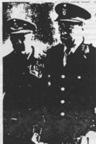
El general de brigada Mario Benjamín Menéndez, a la derecha de la foto, designado por el Gobierno argentino como nuevo gobernador de las Malvinas en sustitución del británico Rex Hunt, se dirige hacia las islas para tomar posesión de su cargo desde Comodoro Rivadavia, ciudad argentina en la cual fue capturada la presente instantánea