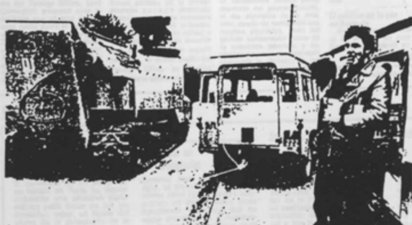
Residentes de las Malvinas contemplan el paso de un carro blindado argentino por las calles de la capital Port Stanley.