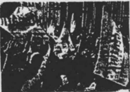
Un grupo de manifestantes haciendo ondear banderas argentinas en un momento de las islas Malvinas y Seguros hasta la sede del Gobierno para pedir la presencia del presidente Galtieri.

Debates en la ONU En las Naciones Unidas, mientras tanto, se ha convocado por segunda vez un menos de 24