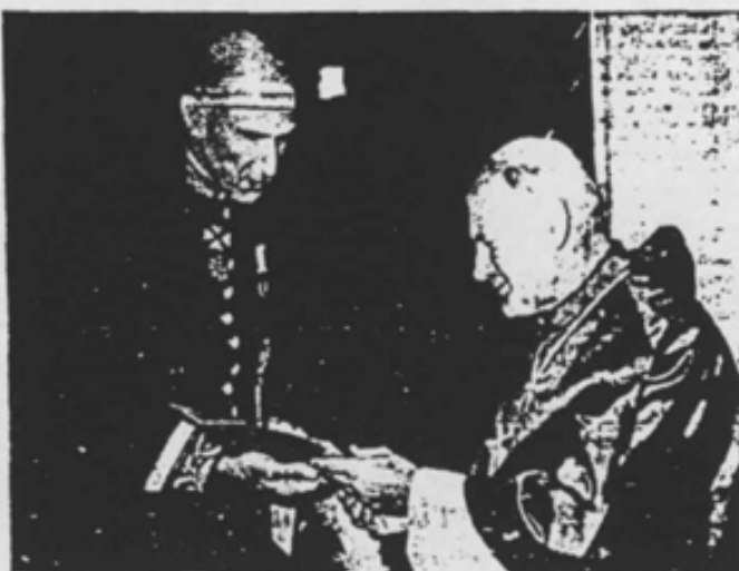
Quedan atrás más de 450 años de ruptura. Sir Mark Evelyn Heath presenta sus credenciales al Papa Juan Pablo II, como nuevo y primer embajador ante la Santa Sede. Durante una ceremonia celebrada en la Biblioteca privada del Pontífice. Esta situación no se daba desde que en 1529 Enrique VIII rompió las relaciones con el Papado. Quedan atrás más de cuatro siglos y medio de ruptura, exactamente 453 años. — [Más información en la página 25]