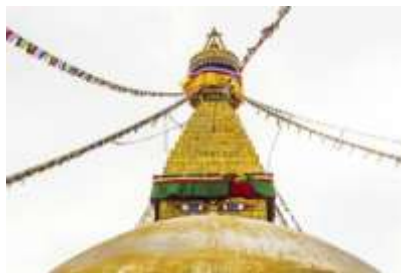
Stupa De Bodnath (Katmandú)

L'exercici que fan amb les tres voltes, fa que reflexionin i intenta transmetre el valor de les actituds positives, i sobre el benefici del canvi que la ment fa al convertir les emocions fosques (dolentes) en clares (bones).