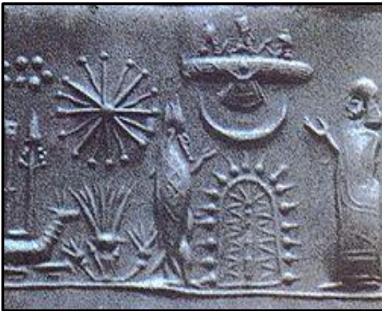
Figura 2 : Segell del primer mil·lenni mostrant un adorador i un savi peix vestida davant d'un arbre estilitzat amb una lluna creixent i disc alat establert per sobre d'ella. Darrere d'aquest grup trobem una planta amb una estrella radiant i el Star-Cluster (cúmulo de les Plèiades). En el fons és el drac de Marduk amb la llança de Marduk i l'estàndard de Nabu sobre el seu llom. Segons els pseudo-arqueòlegs es correspon a una nau espacial.