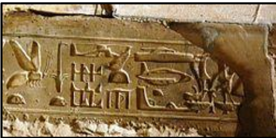
Figura 3 : Jeroglífics corresponents al temple de Abidos, en els que es figura que hi ha una nau espacial representada per part de la comunitat pseudo-científica.