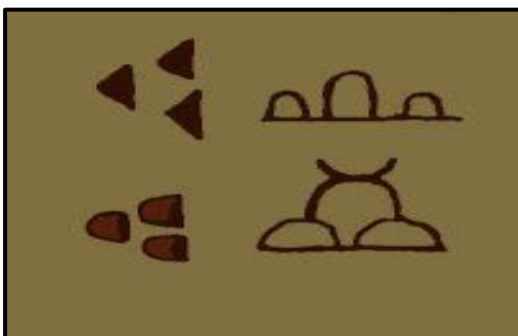
Figura 4 : És tracta de la il·lustració pictòrica del logograma KUR. Dues variants de proto-cuneïforme KUR, que signifiquen "muntanya; terra (estrangera) o més enllà".