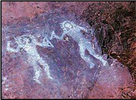
Figura 1 : Pintures rupestres del jaciment de Val Camónica a Itàlia que daten del 1000 aC. Els pseudo-arqueòlegs afirmen que el representat són dos figures que corresponen a dos astronautes.