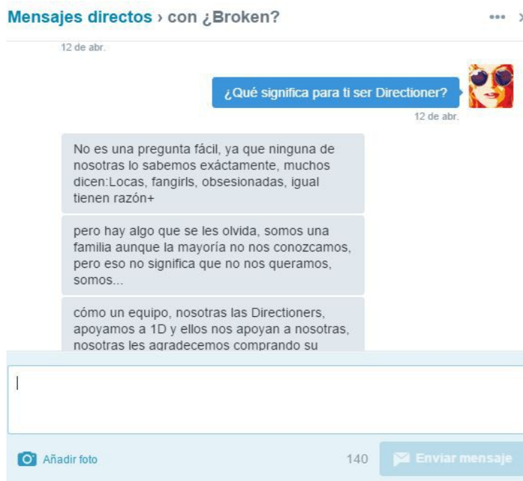
Figura 1: Ejemplo de entrevista a través de Twitter .

Mensajería privada de Twitter : Tal y como se ha comentado anteriormente, ya que fueron muy pocas las fans que enviaron un correo a la cuenta creada para la investigación, se decidió realizar las siguientes entrevistas a través de los mensajes privados de Twitter , ver figura 1. Igual que con las entrevistas por correo, se acordó con cada una de las fans una hora a la que conectarse a Twitter para iniciar dicha entrevista mediante chat en la mensajería privada de esa red social. La limitación de los caracteres resultaba algo incómoda, ya que algunas preguntas y todas las respuestas de las fans se dividían en varios mensajes, pero parecía ser que esa era la única forma de conseguir que las fans accedieran a realizar la entrevista.