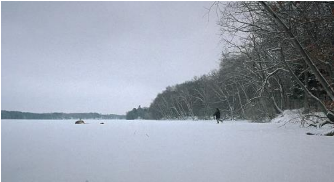
Fotograma de Fargo (2014)

Las condiciones climáticas jugarán un papel crucial en la película convirtiéndose fortuitamente en uno de los antagonistas. Fargo , tanto la película (1996) como la serie (2014), nos ayuda a dibujar el mapa de los alrededores de La Casa y nos muestra camino a seguir con el juego de las profundidades mostrándonos localizaciones desérticas, desoladoras y frías.