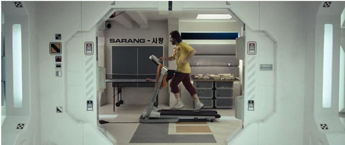
Fotograma de Moon

La película Moon (2009) es una fuente de inspiración para mostrar la soledad, la vida en un mismo recinto y la consiguiente degradación tanto física como mental que eso supone. En nuestra película la inmensidad de La Casa (en el caso de Moon la base lunar) no es espacio suficiente para llenar el vacío emocional de los protagonistas, ya que se ven obligados hacer vida de todo tipo en ella.