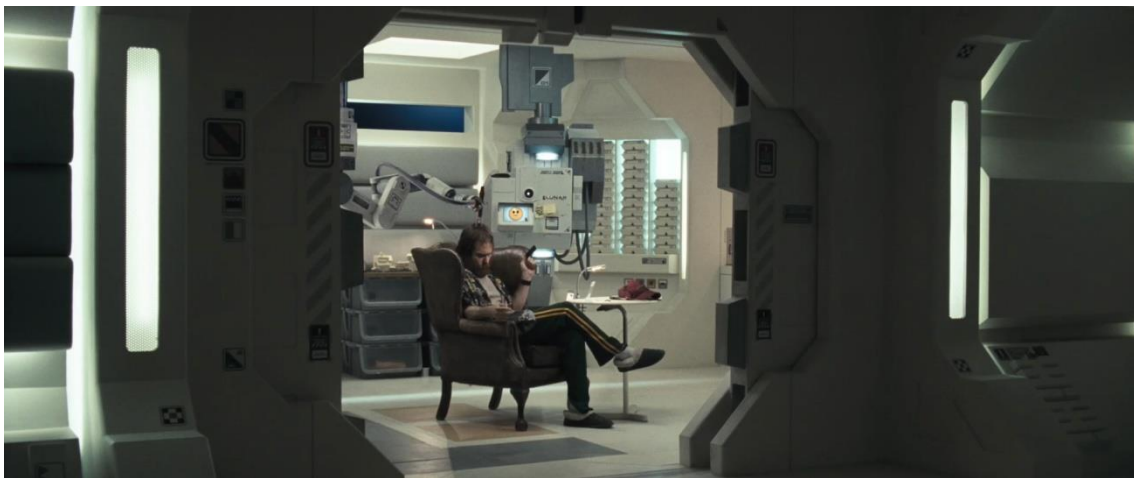
Fotograma de Moon

Sarang , la base lunar de Moon , está ubicada en la Luna apartada de cualquier civilización reduciendo al máximo las posibilidades de abandonar el lugar aumentando así la sensación de abandono y soledad. Lo mismo sucede en E con La Casa, pero en nuestro caso la edificación está situada en una tierra helada e inhóspita donde las condiciones climáticas son las culpables del confinamiento perpetuo de los personajes.