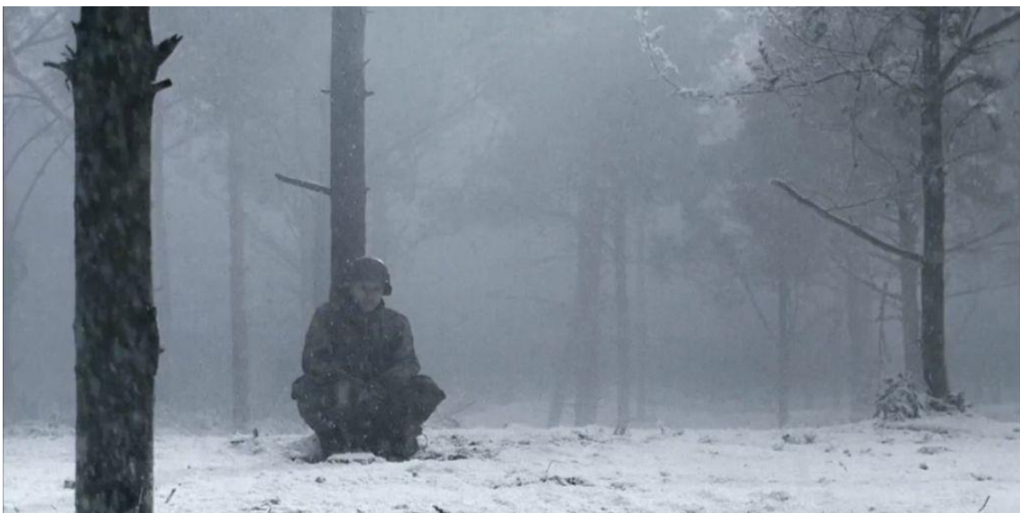
Fotograma de Band of Brothers episodio The Breaking Point