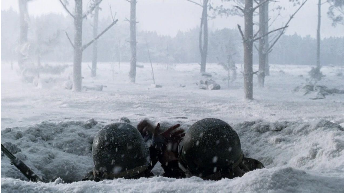
Fotograma de Band of Brothers episodio Bastogne

No obstante, la localización también cuenta con zonas boscosas, pero está no es síntoma de naturaleza, ya que la precipitación continua de nieve la oculta. Por lo tanto, el bosque se nos muestra como una zona estéril en la cual sólo la lucha les servirá para vivir en condiciones aceptables. La miniserie de televisión Band of Brothers , concretamente los capítulos de Bastogne y The Breaking Point , son un ejemplo de la cruda realidad de asentarse en terrenos extremos en los cuales uno está en constante alerta y se siente siempre indefenso