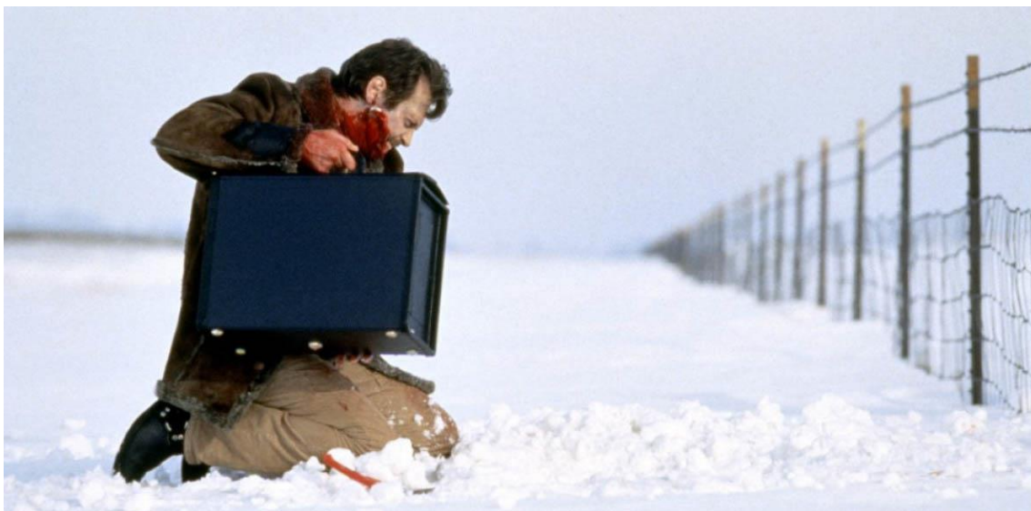
Fotograma de Fargo (1996)