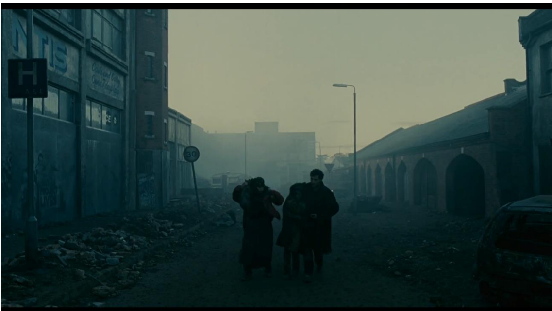
Fotograma de Children of Men