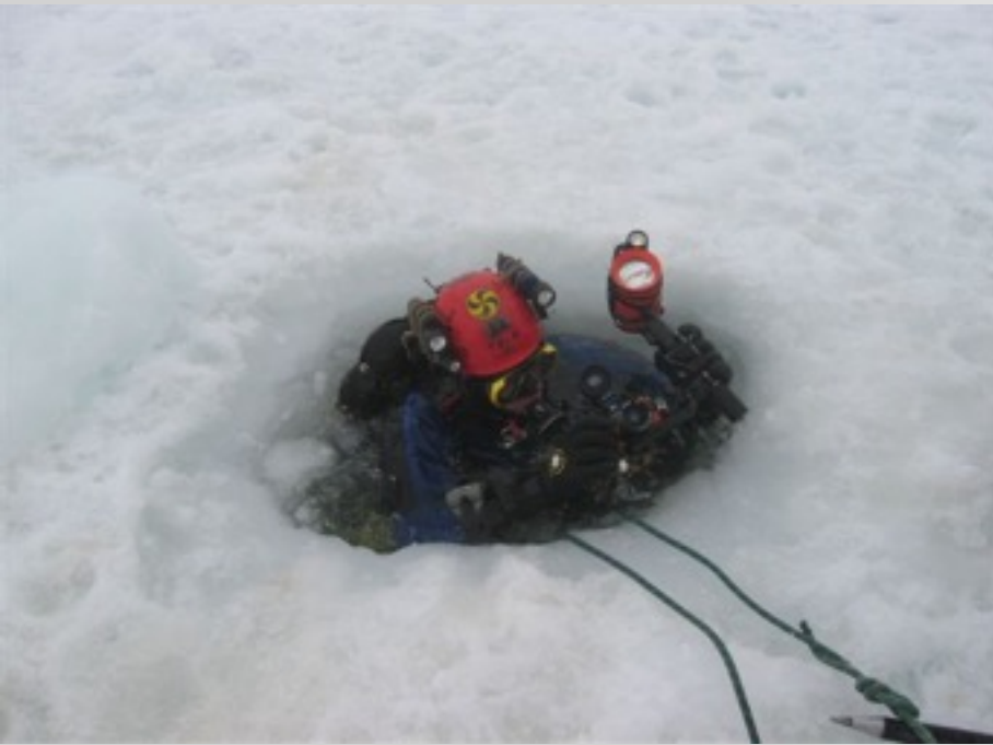
INMERSIONES BAJO HIELO.PIRINEOS