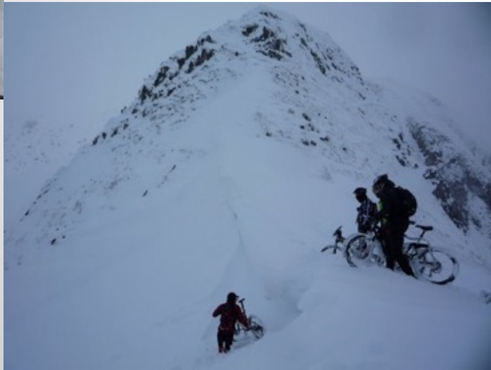
TRAVESÍA INVERNAL EN BICICLETA. PICOS DE EUROPA