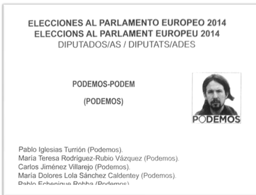
Papereta electoral de Podemos per a les eleccions europees del 25 de maig de 2014. La cara del cap de llista i líder la formació hi apareix, un dels aspectes més polèmics de la personalització de la campanya electoral.