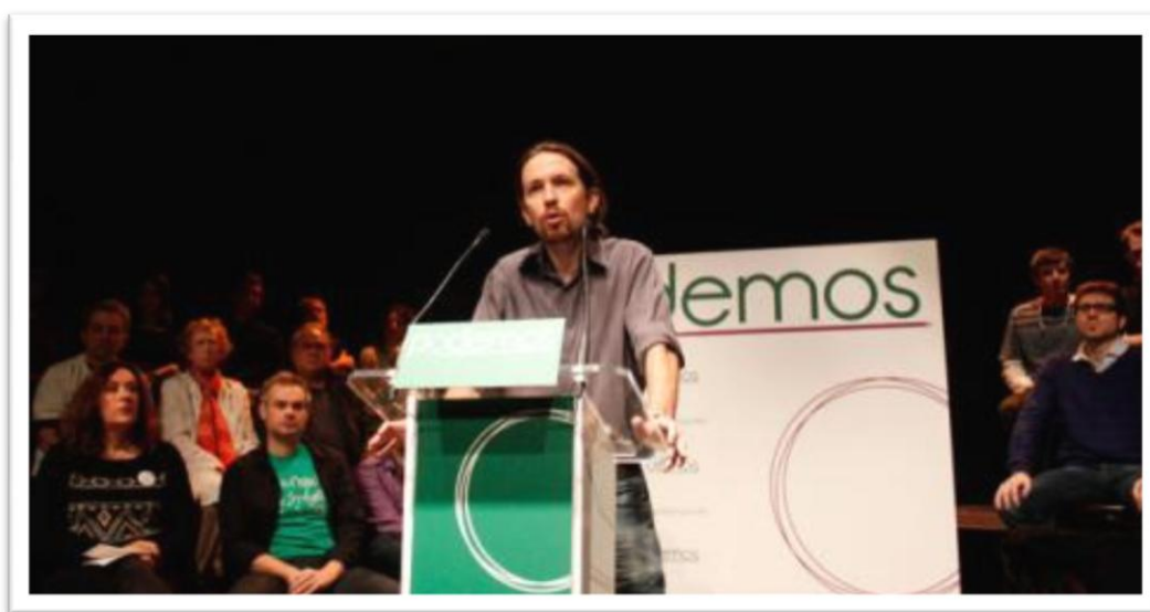
Pablo Iglesias durant la presentació de Podemos al Teatro del Barrio de Lavapiés, Madrid, el 17 de gener de 2014.

"A les places van dir "sí se puede" i ara nosaltres diem "Podemos"" és el començament del discurs de Pablo Iglesias en la presentació del partit que lidera, i la primera frase de l'article que explica la presentació al Teatro del Barrio de Lavapiés al diari Público. La peça es titula "Pablo Iglesias presenta Podemos como "un método participativo abierto a toda la ciudadanía" 6 " i el seu autor és Luis Giménez San Miguel, publicada el 17 de gener de 2014.