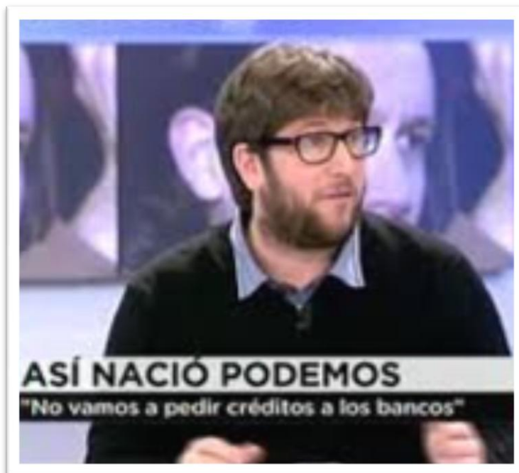
Miguel Urbán, cofundador i responsable de Podemos.

Miguel Urbán Crespo va estudiar Història a la Universitat Complutense de Madrid i com Iglesias i Errejón, va participar activament en les protestes del moviment anti-globalització. Membre d'Izquierda Anticapitalista, va ser cap de llista per a les eleccions madrilenyes de l'any 2011. La seva llibreria cooperativa La Marabunta servia de lloc de reunió per a alguns dels membres de Podemos. També va participar en el moviment 15M i ha escrit varis llibres. Ha treballat com a activista en varies ONGs. És un dels cofundadors i responsables del partit polític i amic íntim del secretari general, Pablo Iglesias. Ha participat com a tertulià en diferents mitjans de comunicació estatals, com Telecinco i La Sexta, i també en el programa La Tuerka.