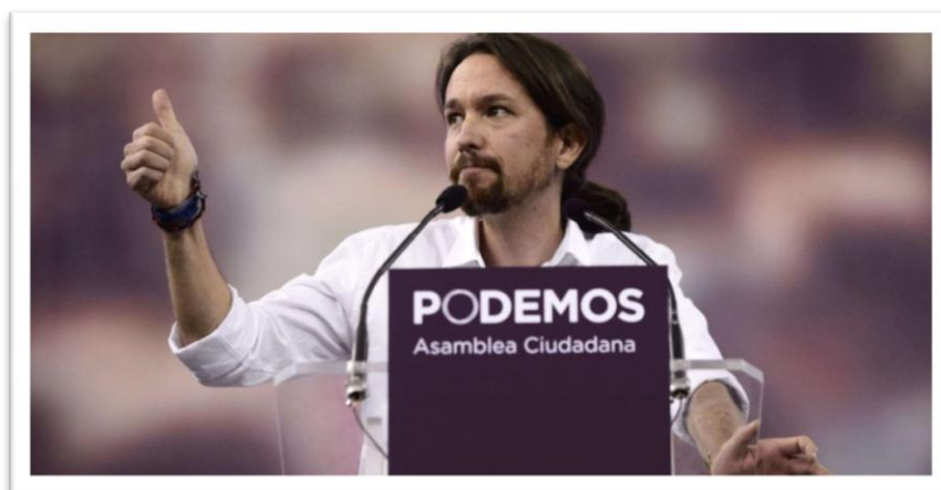
Pablo Iglesias, secretari general de Podemos.

Va estudiar la carrera de Dret i al acabar-la va estudiar la carrera de Ciències Polítiques. Mentre estudiava a la Universitat Complutense de Madrid va participar en el Moviment antiglobalització i de jove va ser membre de la Unión de Juventudes Comunistas de España. Com a politòleg ha servit d’assessor per Izquierda Unida i Alternativa Galega de Esquerda. L’any 2013 comença a aparèixer en televisió nacional com a tertulià en programes com El Gato al agua (Intereconomía), El cascabel al gato (13TV), La Sexta Noche (La Sexta), Las mañanas de cuatro (Cuatro), Te vas a enterar (Cuatro) i La noche en 24 horas (Canal 24H).