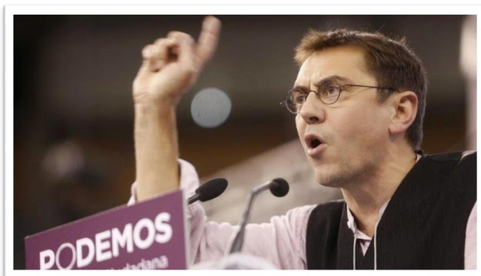
Juan Carlos Monedero, secretari de programa de Podemos.

Com a professor universitari va fer estades com a visitant a la Universitat Iberoamericana de Puebla (Mèxic) i a la Universitat Pontifícia Comillas (Espanya). Va participar activament en el moviment 15M i també participava com a tertulià a La Tuerka, programa d'Iglesias. Posteriorment, amb el ressò del Manifest Mover ficha i el creixement de Podemos, es va anar convertint en una de les figures més reconegudes per les seves constants aparicions en mitjans de comunicació, com Cuatro i La Sexta. Ha escrit 15 llibres, la majoria dels quals sobre el moviment indignat.