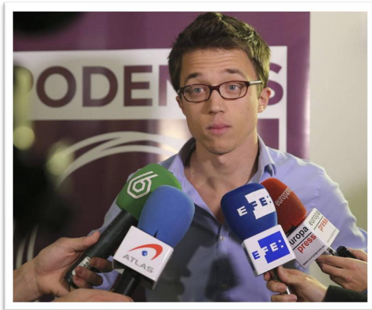
Íñigo Errejón, secretari i director de campanya de Podemos.

Miguel Urbán Crespo va estudiar Història a la Universitat Complutense de Madrid i com Iglesias i Errejón, va participar activament en les protestes del moviment anti-globalització. Membre d'Izquierda Anticapitalista, va ser cap de llista per a les eleccions madrilenyes de l'any 2011. La seva llibreria cooperativa La Marabunta servia de lloc de reunió per a alguns dels membres de Podemos. També va participar en el moviment 15M i ha escrit varis llibres. Ha treballat com a activista en varies ONGs. És un dels cofundadors i responsables del partit polític i amic íntim del secretari general, Pablo Iglesias. Ha participat com a tertulià en diferents mitjans de comunicació estatals, com Telecinco i La Sexta, i també en el programa La Tuerka.