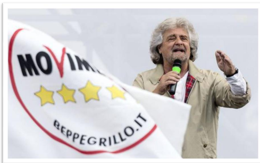
Beppe Grillo, líder del Movimento 5 Stelle, en un míting. En primer pla, bandera amb el logotip del partit.

com progressista, conservador o liberal; “líder no és igual a candidat” escriu Menor en referència a que Beppe Grillo mai ha estat a les llistes del partit tot i ser la cara més visible; i finalment, l’experiència de govern amb la que compta el Moviment 5 Estrelles, “tocant poder des de 2010”.