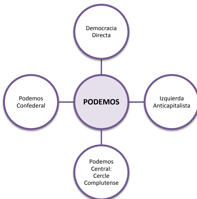
Mapa conceptual de les quatre bases heterogènies que formen Podemos.

Com s'explica en l'article d'Iván Gil, "l'heterogeneïtat és una de les principals senyes d'identitat de la formació liderada per Pablo Iglesias, per lo qual estan emergent una pluralitat de postures respecte a importants qüestions polítiques (com el model territorial, econòmic o de defensa) i organitzatives (convergència amb altres organitzacions polítiques, formes de participació o extensió a moviments socials i societat civil en general)". Segons Gil, "les diferents línies polítiques i d'opinió en el si de l'organització poden agrupar-se en les quatre categories, que no només responen a postulats ideològics, sinó també a les clàssiques camarilles o "famílies". Explica que la que té un pes major en la formació es la que es correspon amb el grup promotor Podemos Central, "els membres del qual han acaparat durant