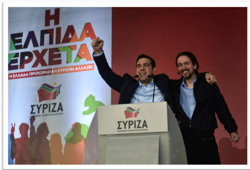
Pablo Iglesias a Atenes amb Alexis Tsipras, donant suport al líder de Syriza en campanya electoral.