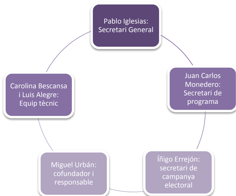
Esquema amb els personatges de Podemos més mediàtics i els seus respectius càrrecs eal partit. Font: el·laboració pròpia.