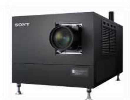
Figura 3. Projector cinema digital