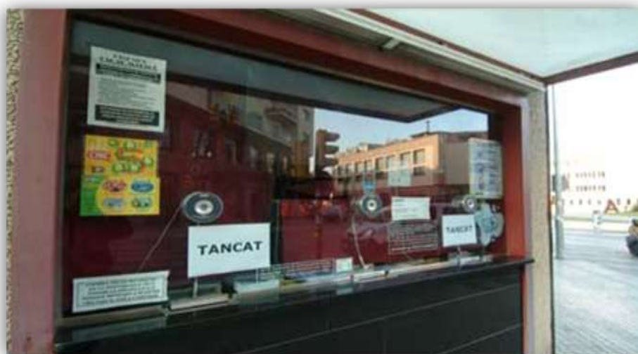
Figura 1. Anunci del tancament dels cinemes Oscar.

Tot i que la família Coll, propietària dels cinemes va decidir tancar totes les sales, va aparèixer una empresa interessada en obrir un altre cinema en algun dels locals ja tancats. Concretament es van obrir els Cinemes Oscar on abans es trobaven els antics Cinemes Mataró. Aquesta és una empresa que té sales per diferents municipis d'Espanya i una gran experiència en el sector. Tot i així el negoci no va durar gaire més d'un any. Això és perquè la població mataronina continuava preferint anar a la multisala del centre comercial. I tal com va passar amb l'Iluro i el Núria, els cinemes Oscar també van haver de tancar. A més, ho van fer de manera inesperada per als mataronins ja que el mateix dia del seu tancament la plantilla en va rebre la notificació i la sala ja no es va tornar a obrir. Els espectadors se'n van assabentar gràcies al cartell que van penjar a la taquilla del cinema.