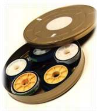
Figura 2. Llauna amb bobines de cel·luloide.

Les sales de cinema analògiques ja són història. El cel·luloide ha deixat pas a l'era digital i les sales s'han vist obligades a canviar o a tancar. Ara, les pel·lícules s'ofereixen en servidors o discs durs i el procés de digitalització - tal como s'explicava al diari Ara - "inclou el canvi de la tecnologia dels projectors analògics, de 35 mm, que tenen una vida d'uns quaranta anys, pels projectors digitals, d'uns 120.000 euros." 18 .