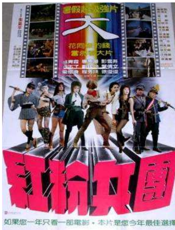
Golden Queen's Commandos (1982).