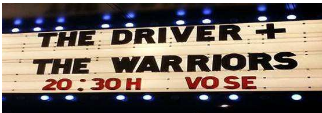
Fotografía propia del autor. Tomada el 6 de Marzo de 2015 en Barcelona

Marquesina del cine Phenomena de Barcelona, con una sesión doble en la que se incluye el film de culto The Warriors (1979), influencia clara en la película Girl with a Gun (1982).