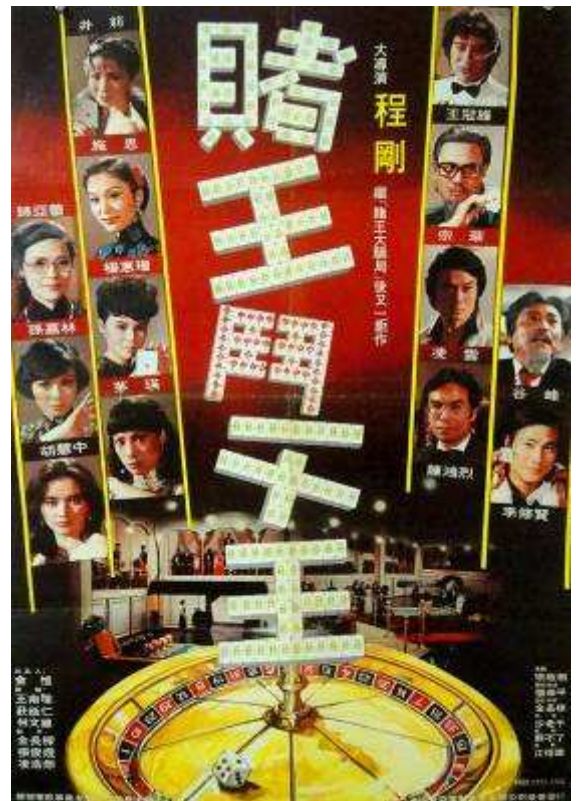
The King of Gambler (1981).