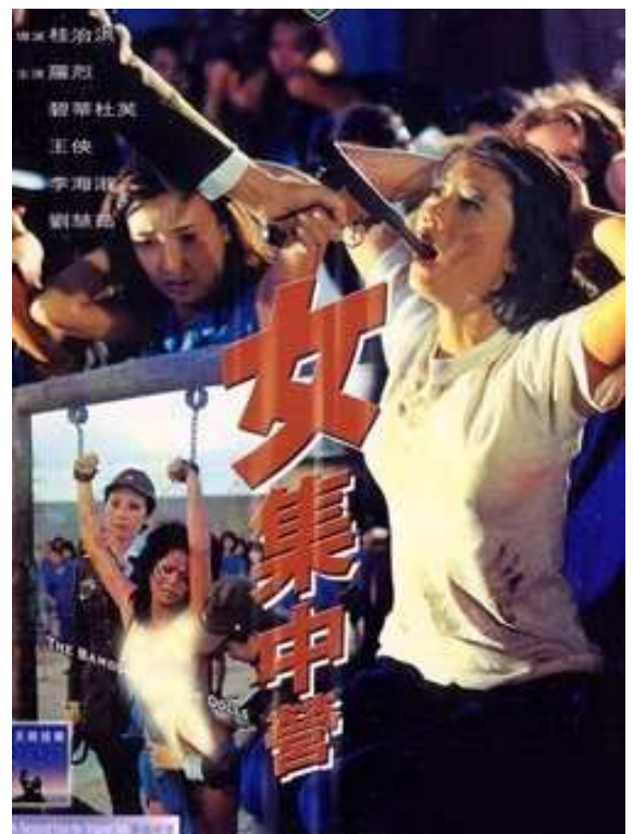
Training Camp (1983).