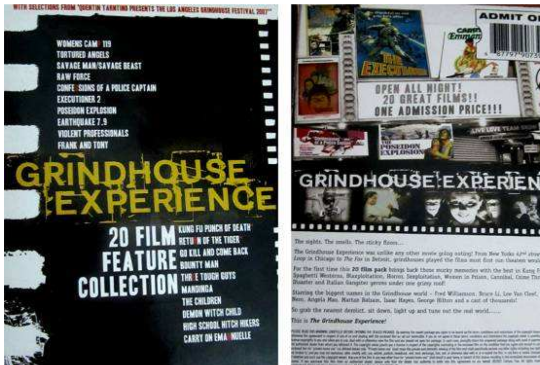
Fotografía propia de la colección personal autor.

La portada indica “With selections from ‘Quentin Tarantino presents The Los Angeles Grindhouse Festival 2007’”, mientras que el nombre de Angela Mao aparece en la contraportada como reclamo comercial junto a otras estrellas de exploitation : “Starring the biggest names in the Grindhouse world – Fred Williamson, Bruce Li, Lee Van Cleef, Franco Nero, Angela Mao, Martan Balsam, Isaac Hayes, George Hilton and a cast of thousands!”