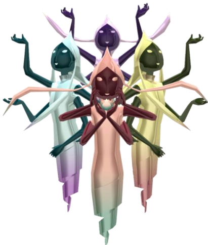
Figura 3. Grans fades a The Wind Waker (Zelda Wiki [en línia] < http://zeldawiki.org/File:GreatFairies_Figurine.png >).

Malgrat el que hem vist fins ara, també són presents elements que s'allunyen de la imatge del medieval europeu. Un exemple són les fades, un aliat present des de la primera entrega. La representació més comú d'aquests éssers és la de noies amb ales en base a l'imaginari mitològic europeu. Aquest esquema és manté amb dues excepcions. El pas a les tres dimensions d' Ocarina of Time (1999) presentava limitacions tècniques que les va reduir a punts de llum brillants amb ales. Això no obstant, les anomenades grans fades sí mantenen l'aparença d'una dona, però s'allunyen del model previ. L'altra variant més destacable és la que es produeix a The Wind Waker (2002). En aquest capítol, les fades