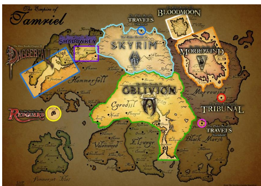
Figura 7. Mapa de Tamriel dividit en els escenaris de cada joc i expansió, exceptuant el primer ( Arena ) que abasta la totalitat del continent ( fan art [en línia] < http://www.reddit.com/r/gaming/comments/1v4f6u/where_all_the_elder_scrolls_games_have_taken_place/ >).

La gran varietat d’enemics que apareixen a la saga ens remet als trops de la literatura fantàstica. Trobem des de grups de bandits, assassins o mags –de totes les races que habiten Tamriel–, fins a criatures sobrenaturals com vampirs o dimonis, passant per animals salvatges. La darrera entrega de la sèrie principal ( Skyrim , 2011) posa l’èmfasi en els dracs, al voltant de qui es desenvolupa part de la trama. Es fa patent, doncs, la relació de l’imaginari medieval amb la fantasia, convertint el sobrenatural o màgic en elements creïbles en aquest marc referencial.