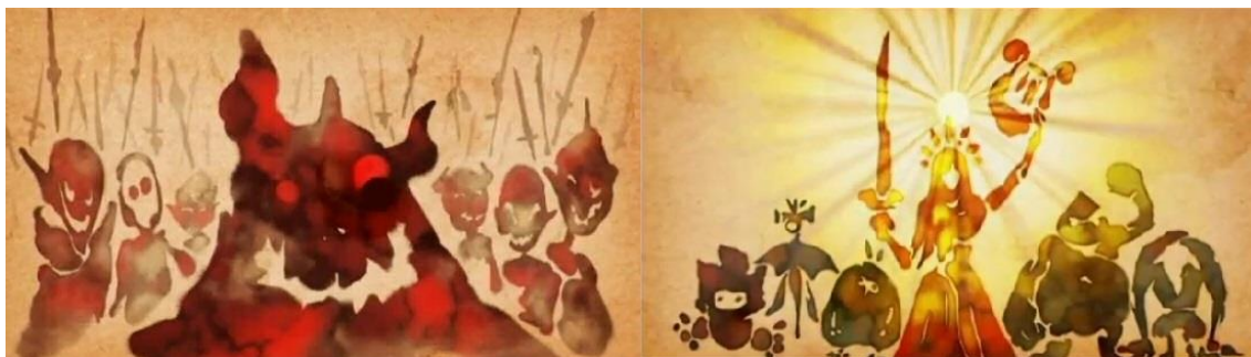
Figura 6. Imatges de la introducció de Skyward Sword (Nintendo, 2014: 71)

vincular-se a un referent contextual, com el de l'edat mitjana, a mostrar una qualitat artística. El focus és diferent al de les entregues anteriors.