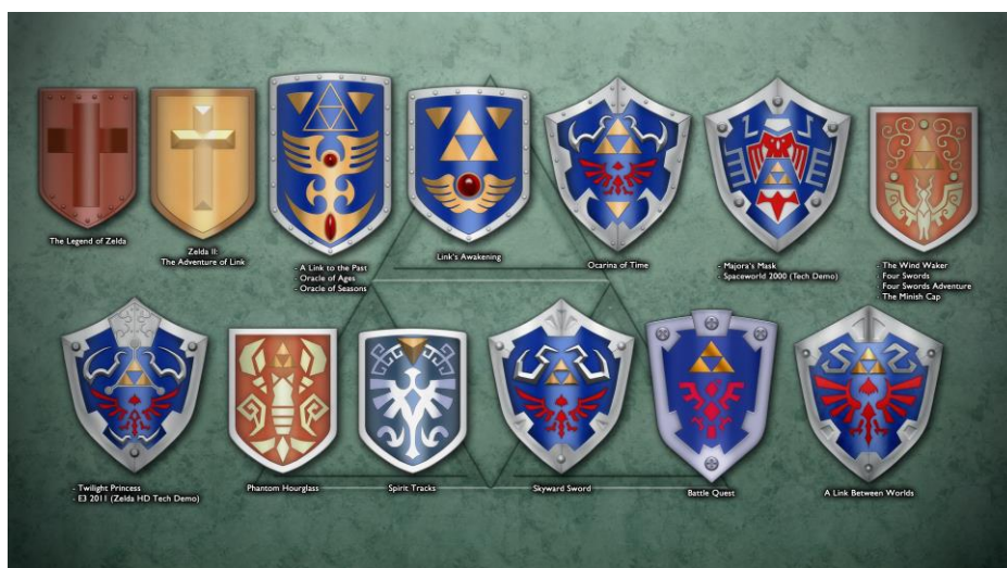
Figura 2. Evolució de l'escut de TLoZ (fan art [en línia] < http://blueamnesiac.deviantart.com >).

fàcilment associable al món medieval europeu d'una creu és substituït per una iconografia pròpia. La popularitat de la saga permet, a partir de la tercera entrega ( A Link to the Past , 1991), deixar de banda elements de fàcil associació en favor de nous símbols que ajuden a cohesionar el món d'Hyrule (fig. 2). El neomedieval no s'esforça en aconseguir una autenticitat històrica, sinó en generar una legitimitat digital i un món virtual coherent (Kline, 2014: 6). Al mateix temps, les millores tècniques permeten l'aparició de més detalls que s'aniran plasmant als jocs. En aquest sentit, destaquen les dues darreres edicions per a consola de sobretaula ( Twilight Princess , 2006, i Skyward Sword , 2011), on els detalls en la indumentària creixen mostrant una cota de malla i altres proteccions característiques de l'imaginari del cavaller medieval.