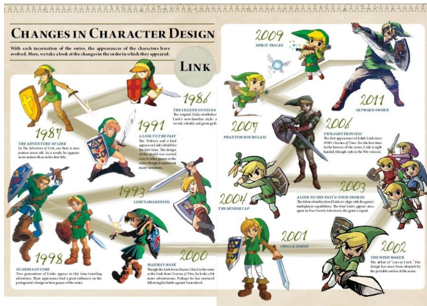
Figura 1. Evolució del protagonista de TLoZ (Nintendo, 2014: 228-229).

Si observem l'evolució del personatge (fig. 1), aquests marcadors del màgic i del medieval es mantenen tot i les modificacions en l'estètica. Un dels canvis més destacables és el que pateix l'escut.