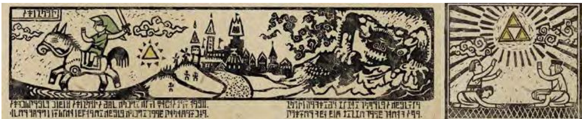
Figura 5. Imatges de la introducció de The Wind Waker (Nintendo, 2014: 123).

Quan ens centrem en el desenvolupament de la trama, també trobem elements que es veuen imbuïts en el neomedievalisme. Les escenes d'introducció, punt de partida de la narració que contextualitzen el joc amb fets previs, en són un mostra. L'inici de A Link to the Past (1991) presenta, en un seguit d'imatges monocromàtiques, una batalla entre soldats caracteritzats amb armadura o uns ancians de llarga túnica practicant un ritual màgic. El fons de color cru i les imatges estàtiques poden recordar a il·lustracions en pergamins o llibres antics. Encara i així, no és clar si hi ha una intenció de recrear aquest referents o si, simplement, no es tenia la capacitat d'elaborar unes escenes més complexes. En canvi, a la introducció de The Wind Waker trobem explicada la història del joc anterior amb la clara voluntat d'evocar un còdex medieval. Un seguit d'il·lustracions senzilles i sense perspectiva es situen al costat de textos en un alfabet il·legible de caràcter rúnic (fig. 5). Aquesta escena busca fer pensar al jugador en els suports d'escriptura medievals i en l'èpica i els romanços de la seva literatura.