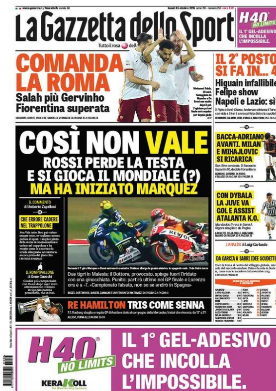
Figura 6 (26/10/2015)