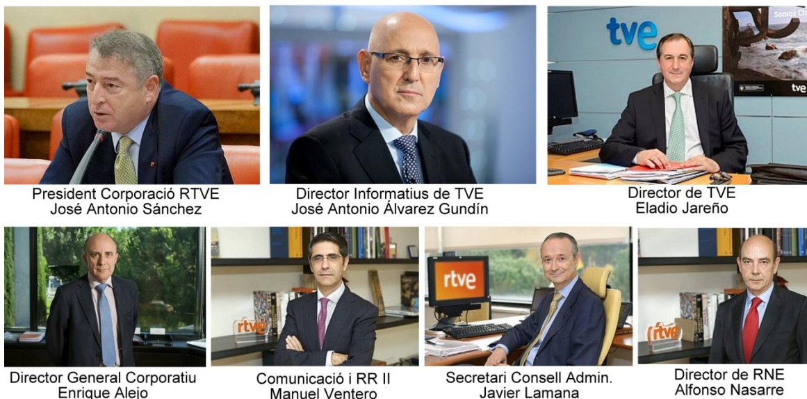
Figura 2. Organigrama de l'actual Corporació de RTVE.