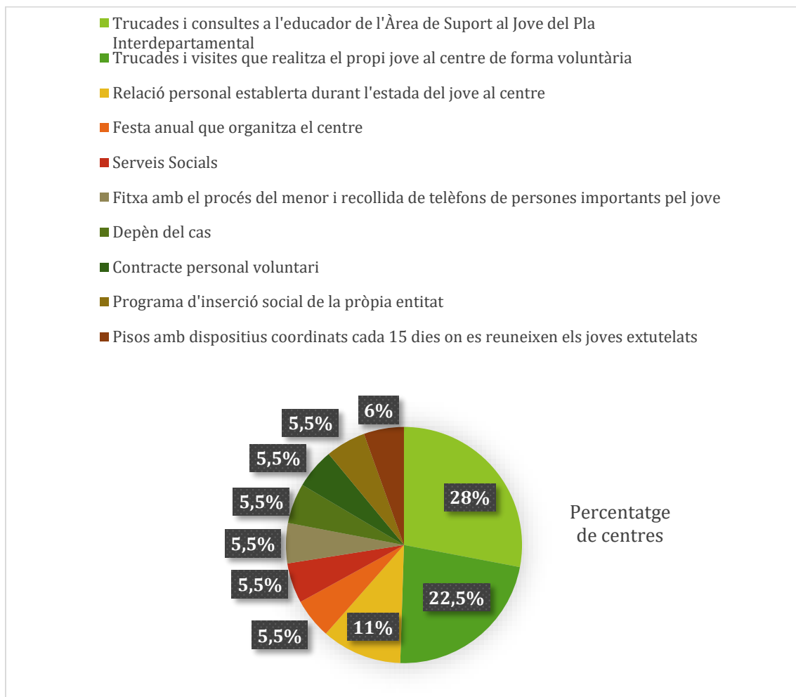
Figura 4. Vies en què els centres coneixen la situació dels joves ex-tutelats