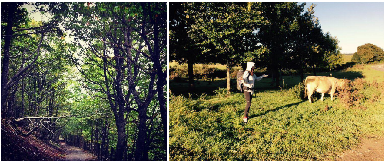
Tejero, Laia (2016) "El Camino de Santiago"

Este contexto nos empuja a enfrentarnos a un terreno natural que en muchas ocasiones (y más en el terreno asturiano) posee características climatológicas que pueden dificultar el proceso de producción.