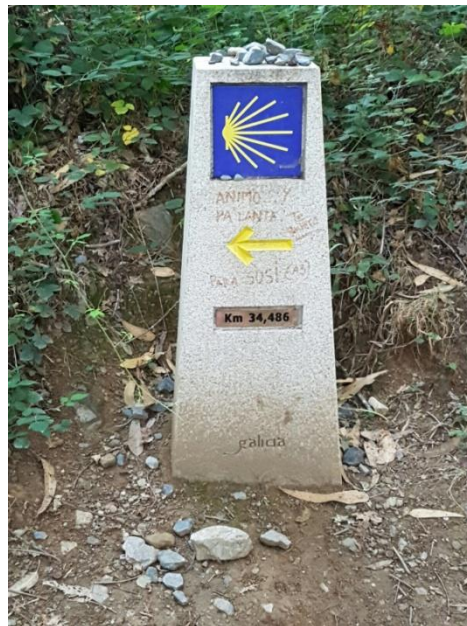
Tejero, Laia (2016) "El Camino de Santiago"