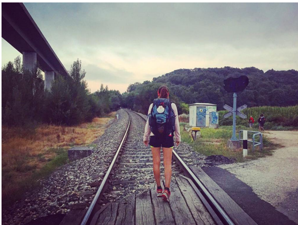
Tejero, Laia (2016) "El Camino de Santiago"

También es interesante incorporar detalles característicos del Camino de Santiago en el atrezo del estilismo de Segura ya que son muy utilizados entre los peregrinos y acentúan aún más la simbología y el carácter de la aventura.