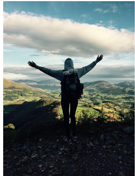
Tejero, Laia (2016) “ El Camino de Santiago ”

Un pequeño tropiezo, lesión o despiste puede convertirse en una tortura constante debido a sus consecuencias, pero pronto se convierte en una anécdota para recordar entre amigos peregrinos. Una noche de albergue entre decenas de desconocidos, ronquidos y malos olores puede ser el tema de conversación y risas de la siguiente jornada de caminata. Este clima, unido a la compañía de un viejo amigo del pasado puede hacer revivir momentos dignos de recordar y crear otros nuevos e inolvidables.