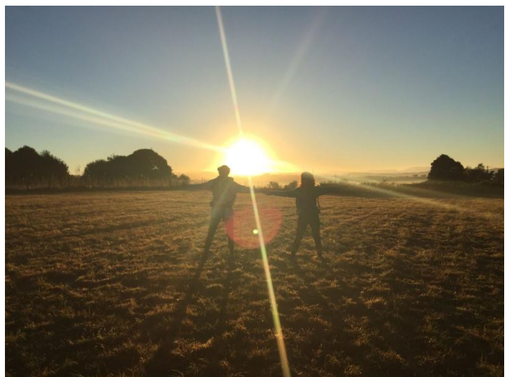
Tejero, Laia (2016) " El Camino de Santiago "