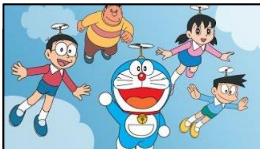
Figura 8. Escena de la serie Doraemon

Este tipo de Manga a la par de entretener también tiene una función didáctica, ya que cada historieta intenta enseñar algo al espectador. En cuanto a las imágenes que aparecen en este subgénero, suelen ser dibujos de trazos claros y simples, con colores primarios. Ejemplos que identificaríamos como kodomo , encontramos a la famosa Hello Kitty de Yuko Shimizu o Doraemon de Fujiko F. Fujio.