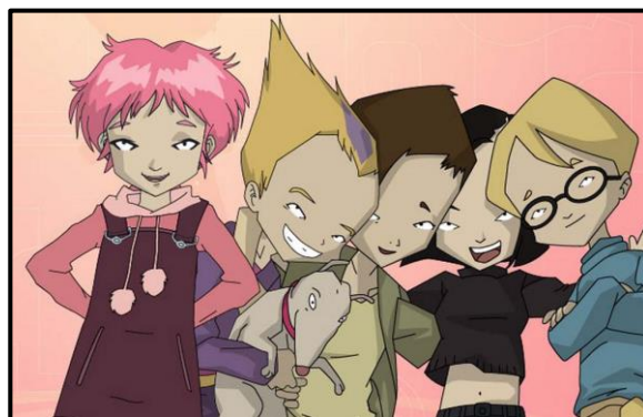
Figura 7: Imagen de los principales personajes que protagonizan la serie Código Lyoko