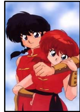
Figura 11. Imagen de Ranma, manifestado en sus dos versiones de mujer y hombre

-Shojo también conocido como shōjo , una traducción que sería algo como “chica joven”. Una pista que nos indicaría que este tipo de Manga está enfocado a un público adolescente, en este caso chicas. Al contrario que el shonen , la gran mayoría de autores de este tipo de historias son mujeres.