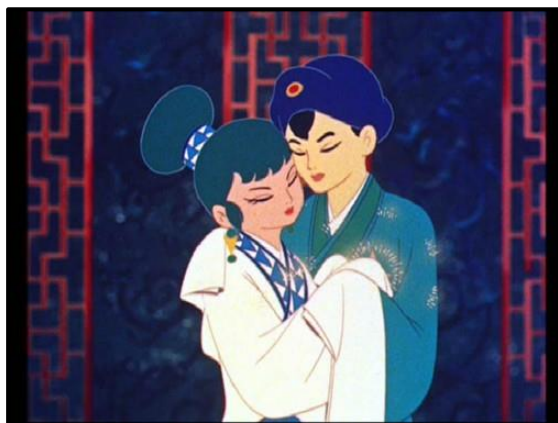
Figura 4. Hakuja Den (1958). El primer largometraje animado japonés en color