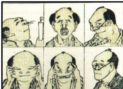
Figura 2. Caricatura de Hokusai Katsushika.

Se trata de una palabra que combina los kanji ( man ) para referirse a informal y ( ga ) a dibujo. Por lo tanto el Manga se podría traducir literalmente como una especie de “garabato o dibujo caprichoso”. Estas representaciones gráficas, nacen como una vía para expresar el sentimiento popular, considerado el arte del y para el pueblo. (Santiago, 2010: 33-34)