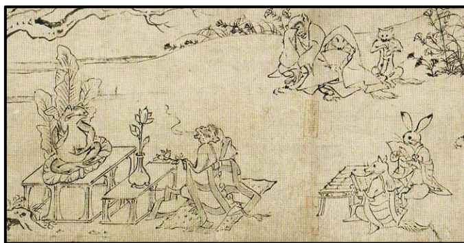
Figura 1: Chojugiga del siglo XII

Estos vestigios del cómic japonés aparecieron durante el siglo XII, atribuidos al sacerdote Toba (1053-1140). Eran los denominados Chojugiga , rollos monocromados donde se representaban dibujos humorísticos de animales antropomórficos. Los cuales simbolizaban actividades humanas, todo ello acompañado de un vestuario y fondo típico de la época. Una escenografía basada en ambientes naturales y una indumentaria basada en trajes milenarios, como el kimono.