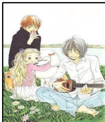
Figura 13. Escena de la serie Honey and Clover

-Josei es un género dedicado a mujeres más adultas, una evolución del shojo , por lo tanto el rango de edad incrementaría entre 15 y 50 años, más o menos. El tema principal de este tipo de novelas gráficas es el sexo y la sexualidad, desde el punto de vista de una mujer. Dando énfasis a los sentimientos como la pasión en todas las historias de esta rama. El josei pasa a tener un estilo mucho más cuidado, donde los personajes tienen unos rasgos más realistas, representados con ojos más pequeños, expresiones más marcadas... Dentro de este subgénero destacan obras como Honey and Clover de Chika Umino, una historia de amor de 3 jóvenes que viven la misma residencia universitaria.