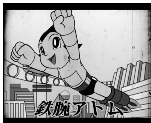
Figura 5. Imagen de la serie Astro Boy