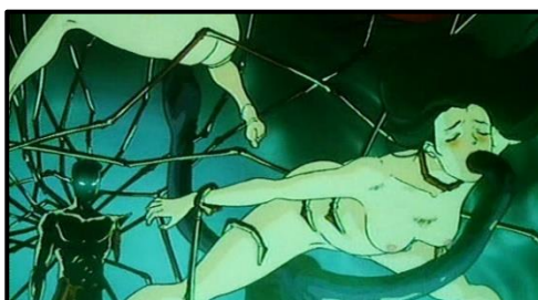
Figura 20. Escena de la serie Urotsikidojo, donde se representa un personaje siendo penetrado por diferentes tentáculos

Una serie referente de este género es Urotsikidojo del maestro 20 Toshio Maeda, que relata la historia de Amano Jyaku, un hombre-bestia y su aventura a la caza del gran Chōjin un monstruo malvado, que tiene como finalidad salvar el mundo.