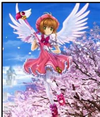
Figura 12. Imagen de la protagonista de la serie Sakura, la cazadora de cartas

Algunos ejemplos de shojo sería la mítica serie Sakura, la cazadora de cartas escrita e ilustrada por el grupo creativo CLAMP 13 , que trata la historia de una adolescente que obtienen poderes tras haber liberado un conjunto de cartas mágicas.