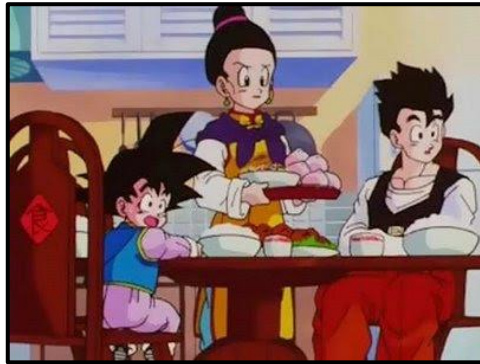
Figura 10. Imagen de la serie Goku, donde aparece la mujer de Goku, Chichi, asumiendo el rol de ama de casa

adoptando esta tanto características físicas como psíquicas propias de un hombre. En este caso, el último ejemplo rompería los esquemas del shonen , ya que el autor de este Manga es una mujer, pero aun así masculiniza a dicho personaje, siguiendo los estándares del género.