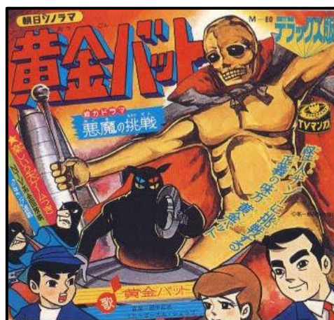
Figura 3. Portada del Manga Ōgon Bat

Otra característica que nos ayudará a relacionar algún dibujo con el Manga, son los peinados poco convencionales o la gran expresividad que reflejan los rostros de los personajes en toda situación. (Kelts, 2006: 90)