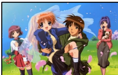
Figura 16. Imagen de los personajes de la serie Kanon

Dentro de la misma línea gráfica, encontramos por contrapartida al lolicon el shota-con . Historias basadas en relaciones sexuales de menores, pero en este caso niños con adultos (tanto hombres como mujeres) o entre dos jóvenes. Algunos ejemplos de estos dos tipos de Hentai los encontramos en obras como la serie Anime Kanon de Mariko Shimizu que estaría dentro del género Lolicon y por otro lado el Manga titulado RNKO de Natsumi Tanaka.