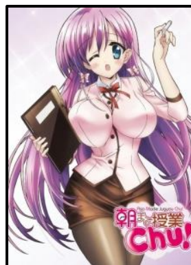
Figura 14. Ayana Kakinozaka una de las protagonista de la serie Asa made Jugyou Chu!