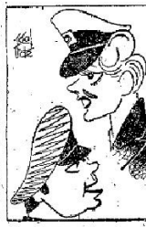
Rita Hayworth y Orson Welles

La película, admirable, sólo cuenta un error: Rita. La feminidad—baja rubia—de la actriz, apenas si cubre su falta de genio. Bellísimas las fotografías, muestra la dirección, interesante el guión, hábilmente arrancado de una novela, y Welles como galán frío, justo. Los baches narrativos fueron bien salvados y las escenas finales en culminación de interés y de picardía cinematográfica. La mano maestra del realizador prende el interés y mantiene al público en tensión, y este público que no ha respirado en una hora—por lo menos el de la tarde del estreno—al terminar la cinta se enfada y protesta. La razón puede ser sencilla: iban a ver a Gilda y se encontraron con una actriz mediocre, admirablemente enojada en una gran película. Y los desencantos suelen ser ruidosos.—L. DE A.