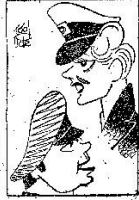
La película, admirable, sólo cuenta un error: Rita. La feminidad—baja rubia—de la actriz, apenas si cubre su falta de genio. Bellísimas las fotografías, muestra la dirección, interesante el guión, hábilmente arrancado de una novela, y Welles como galán frío, justo. Los baches narrativos fueron bien salvados y las escenas finales en culminación de interés y de picardía cinematográfica.

son Welles e interpretadas por él mismo, y Welles tenía en el momento de rodar la cinta otras preocupaciones más hondas que mostrar al espectador las cualidades esmeraldas de la mujer que escogió. Así, pretende manejar a la actriz como artista capaz de una buena floción dramática, y no la hizo bailar, ni oruguear verticalmente, ni, en fin, cascaer cuanto debe ser recatado. Quizá la película tiene en su versión española algún oportuno corte, pero su línea está en el trazo morboso de un frío crimen, en el que la pasión es otra.