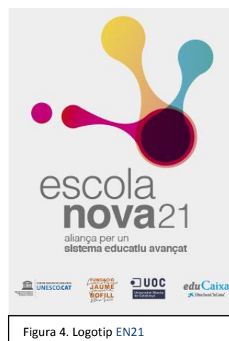
Figura 4. Logotip EN21

La creació de xarxes en el marc del projecte EN21 és evident. De fet, EN21 és, en si mateixa, una “aliança d’entitats privades” diverses (UNESCO Cat, Fundació Jaume Bofill, Universitat Oberta de Catalunya, i eduCaixa) 20 . La voluntat d’ EN21 és “aprendre col·lectivament” i “fonamentar de manera ferma els objectius del marc comú ”, per “construir aquest sistema educatiu avançat on tots els infants i joves gaudeixin d’un aprenentatge rellevant i amb sentit” (Escola Nova 21, 2017). I per assolir-ho, desenvolupen treball en xarxa i de reproducció de model . El programa ha aglutinat al voltant seu actors amb valors i objectius similars. També ha concentrat el recolzament