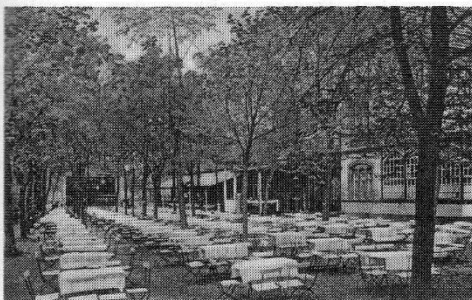
Horns Kurhaus, Konzertgarten (1920)