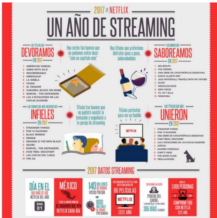
Cuadro 1: Consumo de series en España, Netflix. MediaTrends by Media markt.

A nivel mundial, los datos varían poco, tal y como se observa en el siguiente cuadro.