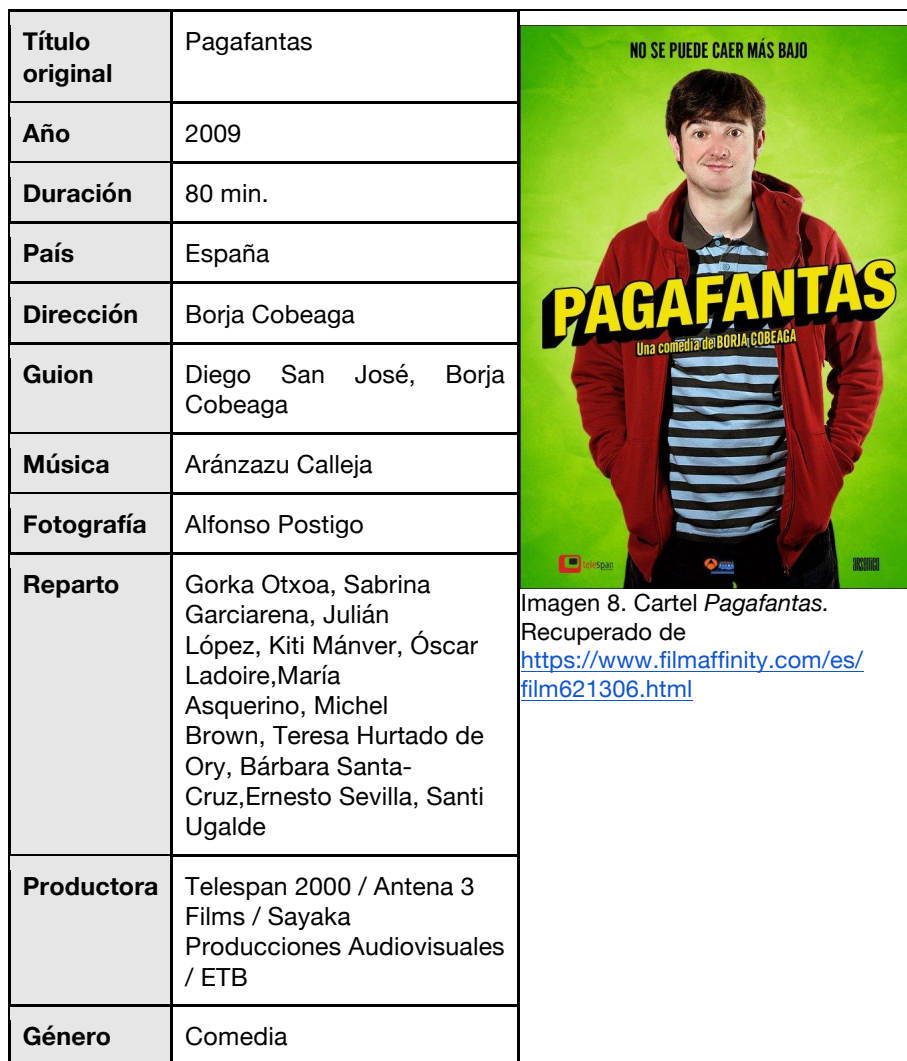
Tabla 9. Ficha técnica de Pagafantas . Recuperado de https://www.filmaffinity.com/es/film621306.html

Pagafantas cuenta la historia de Chema, un joven que justo ha dejado a su novia de toda la vida para conocer a otras chicas. Finalmente, conoce a Claudia, una argentina que le ha enamorado. Ante los intentos de Chema siguiendo los consejos de su tío Jaime por conquistarla, ella solamente lo ve como un amigo.