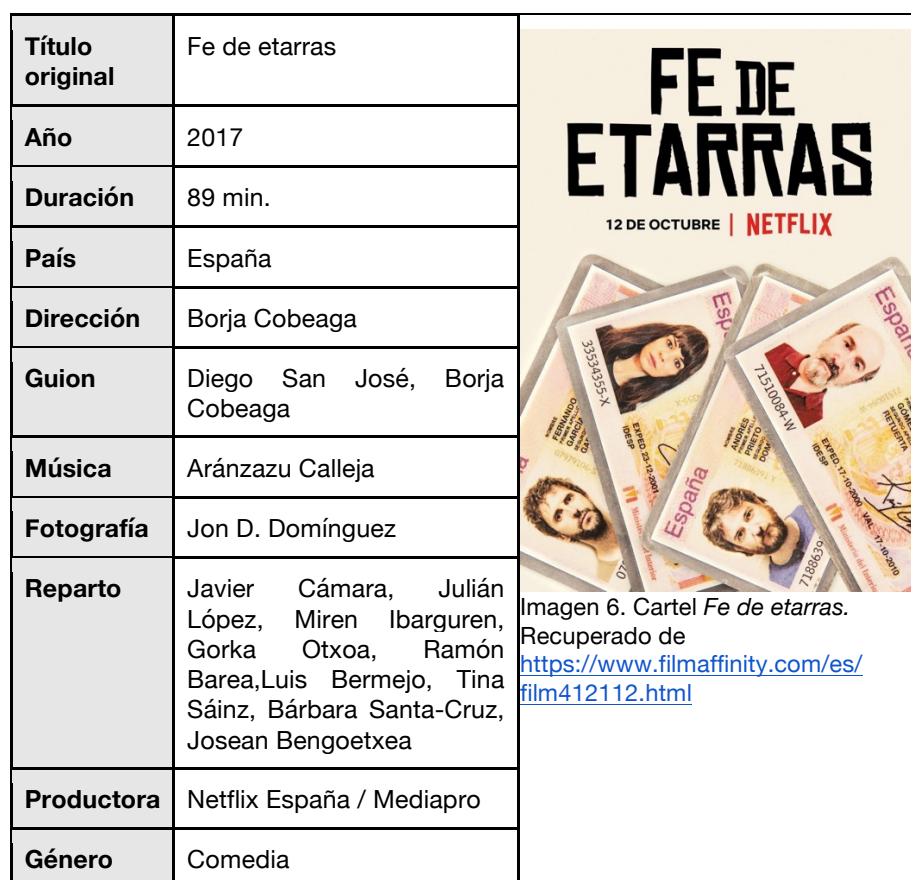
Imagen 6. Cartel Fe de etarras . Recuperado de https://www.filmaffinity.com/es/film412112.html

El ritmo de la película, los chistes, los diálogos absurdos y los personajes tan esperpénticos han sido las referencias de este film. Joaquín, el limpiador del hospital podría ser perfectamente un personaje sacado de este film y Manolo, el protagonista, un hombre que haría lo que fuese por ver el partido clasificatorio de su equipo de toda la vida. También, el uso que se hace en este film de los gags como el de “las pajillas” para caracterizar a los personajes, ha servido también para la creación de los personajes de Amor de suegra , que algunos como Pepe, utilizan sus frases repetitivas que hacen reír al espectador. En el caso de Pepe, cuando está maquinando un plan y Manolo tiene dudas sobre este, siempre le acaba recordando que confíe en él y que lo deje en sus manos.