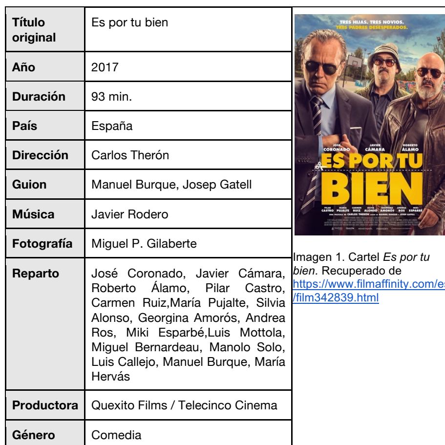
Imagen 1. Cartel Es por tu bien .

El siguiente apartado, llamado “Referentes cinematográficos”, está compuesto por un análisis de algunas de las películas que han servido de inspiración para la escritura del guion de Amor de suegra . El análisis en cuestión, consta de una ficha técnica y repaso de los temas principales que han servido como referencia y sugerencia para tratar los diferentes aspectos del cortometraje. Por tanto, el análisis no se trata de un profundo estudio de las temáticas principales de las películas escogidas, sino sólo de aquellas temáticas que meramente se ven reflejadas de alguna manera en el guion escrito.