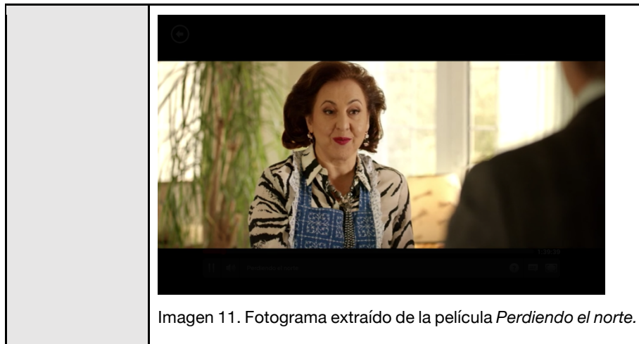
Tabla 12. Ficha personaje Paqui.