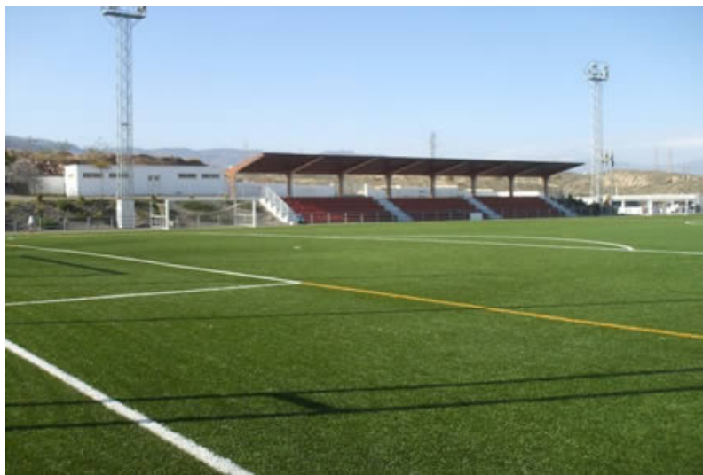
Imagen 17. Campo de fútbol.

Teniendo en cuenta que el equipo va a pasar a la Tercera División de la Liga de Fútbol, el terreno tendría que ser de césped ya que está prohibido en esas categorías el terreno de tierra. Si que es cierto que me gustaría que fuese de tierra para que tenga un toque más rústico y local pero siendo realista y verosímil, si van a pasar a Tercera División, tendría que ser de césped. Por lo que hacer referencia a las instalaciones, tiene que representar un campo de fútbol local, por lo que tiene que haber una grada pequeña-media, que pueda llenarse con facilidad por los aficionados y habitantes del pueblo y unas banquetas de madera en el terreno de juego para la escena final.