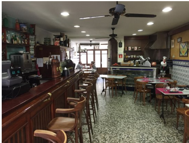
Imagen 16. Bar tradicional de pueblo. Recuperado de https://www.tripadvisor.es/ShowUserReviews-g675099-d10788011-r448991273-Bar_Casal-Vallromanes_Catalonia.html