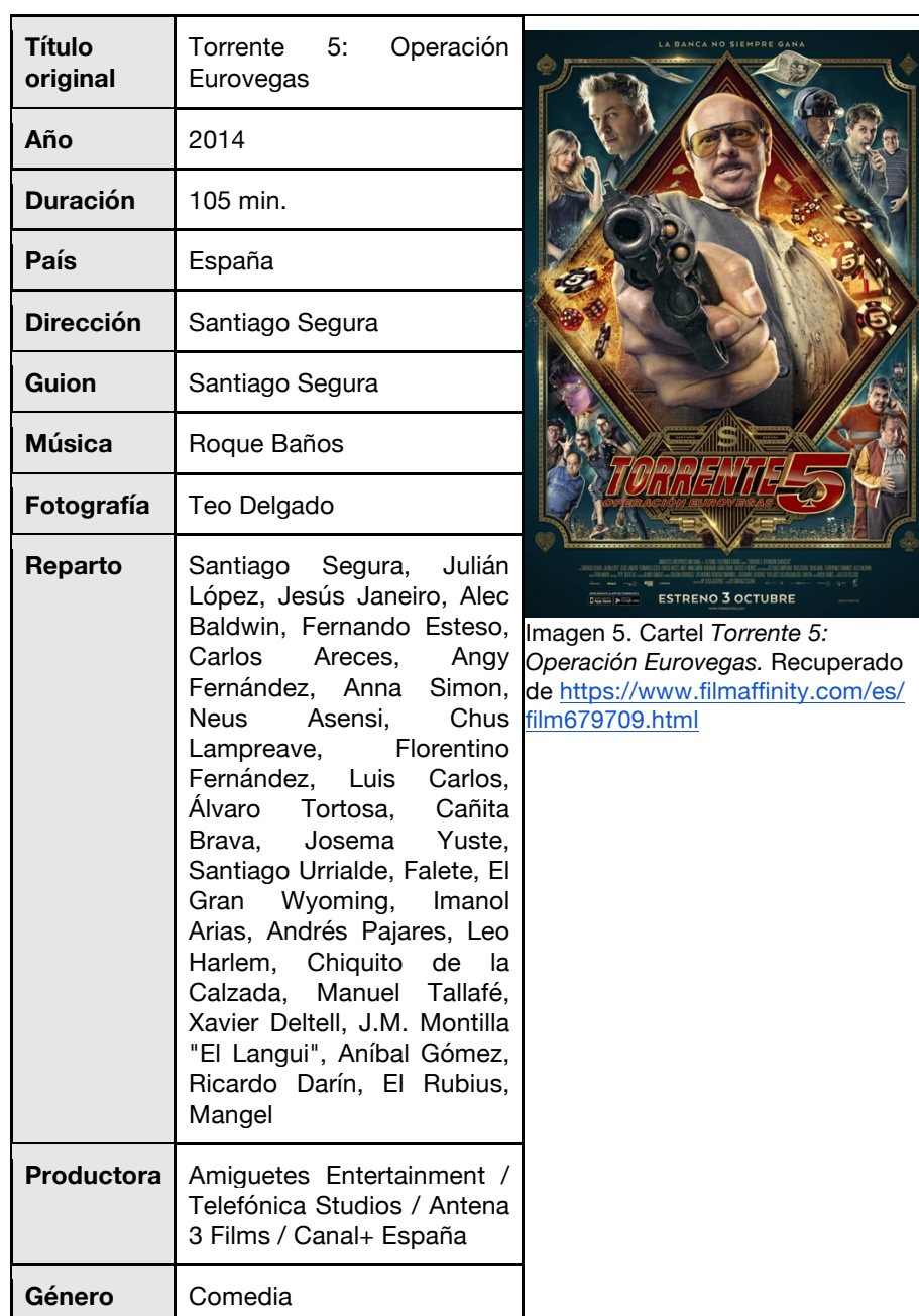
Imagen 5. Cartel Torrente 5: Operación Eurovegas .

También, la estructura que tiene el film es interesante y funciona para captar la atención al público, como por ejemplo, el inicio tan explosivo.