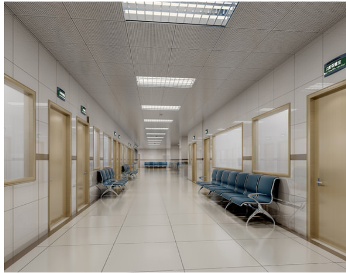
Imagen 18. Hospital de referencia.

El hospital podría ser uno cualquiera. Tanto la habitación como el pasillo de cualquier hospital valdría. Los colores blancos, azulados y neutros de los hospitales hacen que sea un ambiente particular y lo que sí que sería fundamental para el rodaje del cortometraje, sería que contase con una puerta de emergencia que dé al exterior. Que considero que no es ningún problema porque la mayoría son así.