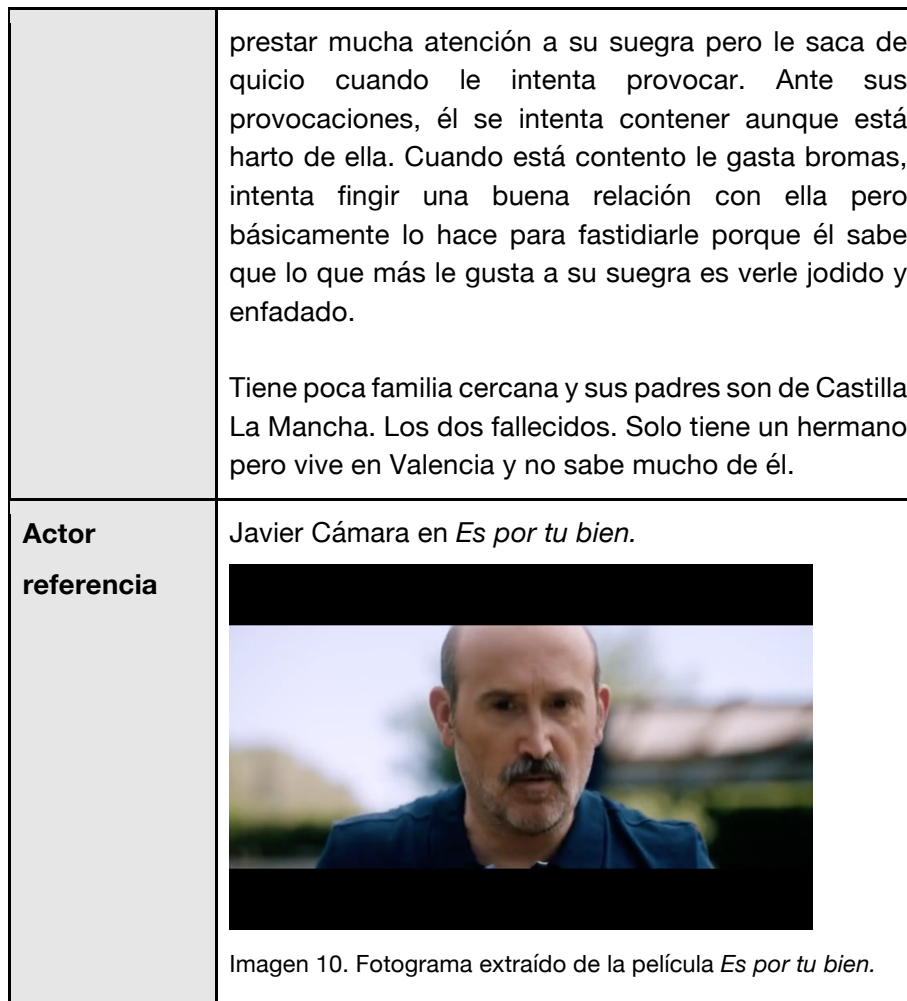
Tabla 11. Ficha personaje Manolo.