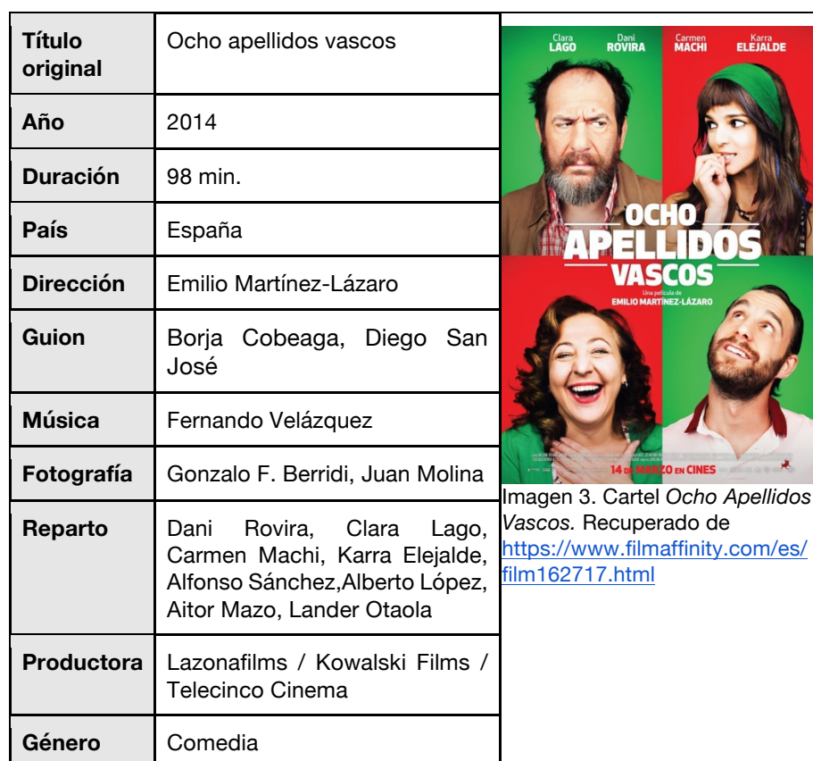
Tabla 4. Ficha técnica de Ocho Apellidos Vascos . Recuperado de https://www.filmaffinity.com/es/film162717.html

con una buena interpretación, como la de Julián López y Yon González, el espectador no puede parar de reír. Por tanto, las diferentes características de comedia tipo “screwball” que se pueden apreciar en este film, como son los diálogos rápidos, las situaciones de farsa, el ritmo...etc. han servido de referencia para aplicarlo a la hora de escribir el guion y visualizar cómo sería Amor de suegra .