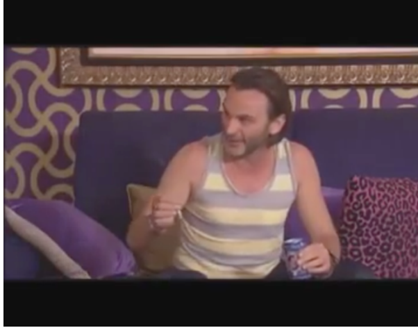
Imagen 13. Fotograma extraído de la serie La Que Se Avecina .

Tabla 14. Ficha personaje Pepe. Fuente: Elaboración propia.