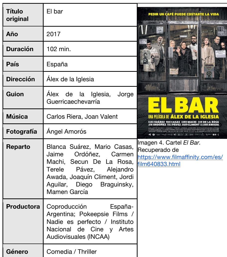
Imagen 4. Cartel El Bar . Recuperado de https://www.filmaffinity.com/es/film640833.html

Es una comedia muy divertida con unos diálogos también interesantes y dignos de admirar. Tiene unos gags muy buenos que no dejan de sorprender al espectador, acompañado de como he mencionado anteriormente, un ritmo muy rápido en el acontecimiento de los sucesos del film. El protagonista del film se tiene que buscar la vida para salir de sus meteduras de pata, como le sucede a Manolo.