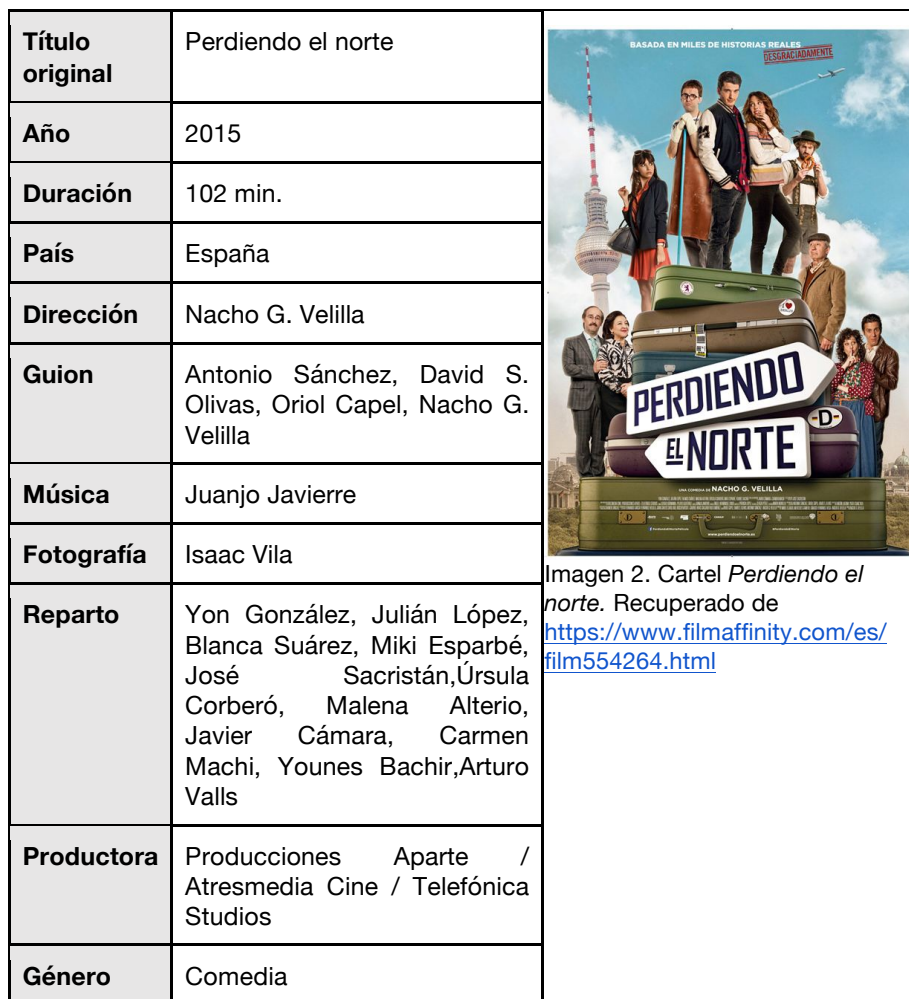
Tabla 3. Ficha técnica de Perdiendo el norte . Recuperado de https://www.filmaffinity.com/es/film554264.html

Perdiendo el norte relata las dificultades de dos jóvenes universitarios, Hugo y Braulio, en un país extranjero.