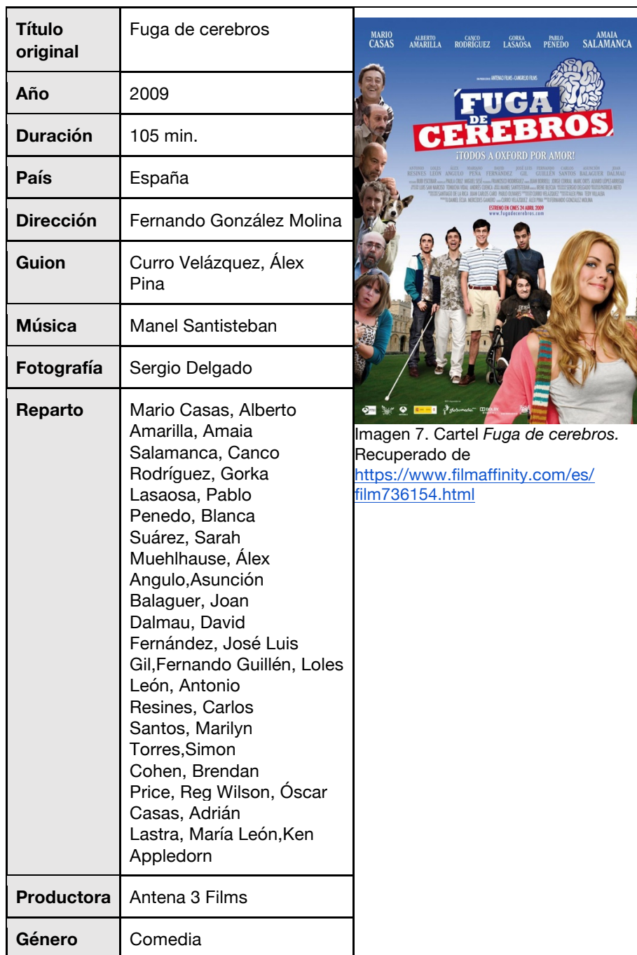
Imagen 7. Cartel Fuga de cerebros .