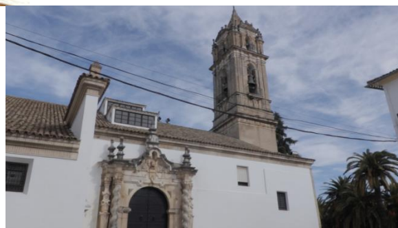
Il·lustració 4. Església de Cabra.

altres indrets típics de Cabra, que condueixen a l' època en que la Sole encara vivia a Andalusia.