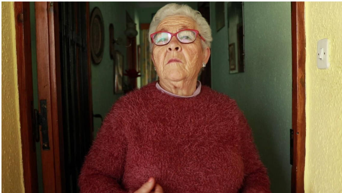
Il·lustració 1. Sole. Font d'elaboració pròpia

Sobre el so, i en relació a l' estil, cal destacar que no s' ha volgut identificar la música amb cap personatge o lloc a excepció de l' escena on apareixen plans de Cabra. S' ha decidit així perquè la música, de tipus folklòrica, ajuda a contextualitzar. La resta de melodies serveixen per separar el moment en què es troba a Lliçà i el moment que es troba a Andalusia. El que si cal aclarir és que hi ha certa càrrega emocional en les melodies, però de forma no tendenciosa o sensacionalista. En el cas de Lliçà, la música ha de ser més accelerada per donar ritme a les accions que la Sole du a terme. En el cas de Cabra, pel record de moments passats i els seus orígens, el moment de decidir marxar, el record dels