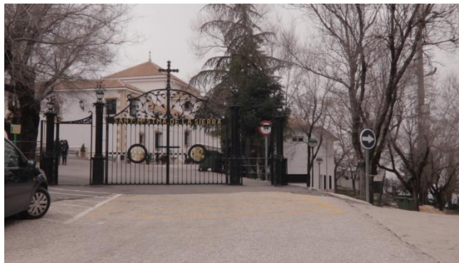
Il·lustració 3. La Sierra de Cabra.

serralada de gairebé 2.000 metres d' alçada. Per les romeries, quan la Sole encara vivia aquí, pujaven i baixen a la Virgen 1 cop l' any.