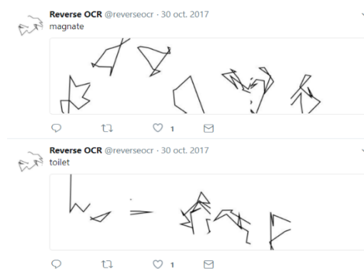
Figura 2. Reverse OCR.

Al tener una API abierta, existen infinidad de aplicaciones que interactúan con Twitter. Para el tema que nos concierne que es el tratamiento de imágenes existen algunas aproximaciones de proyectos que aplican algoritmos OCR como, por ejemplo: Reverse OCR [1] , Figura 2.