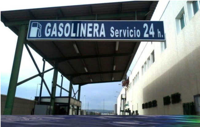
Figura 9. Imagen para reconocimiento de texto

En este momento, el algoritmo estará listo para ser ejecutado. Para ver que funciona correctamente se ha utilizado la imagen de la Figura 9 .