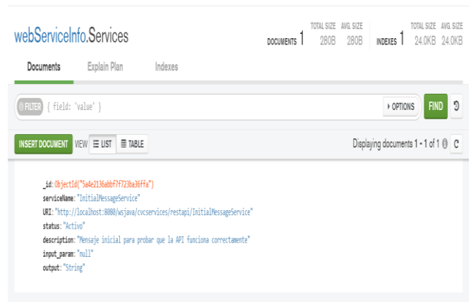
Figura 5. Documento con la información de un servicio en la base de datos MongoDB.

[ { "_id": '{{ServiceID()}}', "serviceName": '{{serviceName()}}', "uri": '{{uri()}}', "status": '{{status()}}', "description": '{{description()}}', "input_parameters": '{{parameters()}}', "output": '{{output()}}' } ]