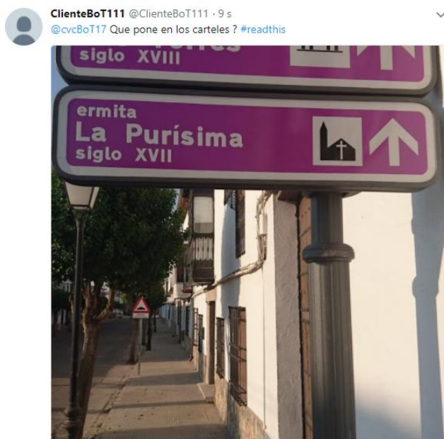
Figura 1. Ejemplo de petición de un servicio.