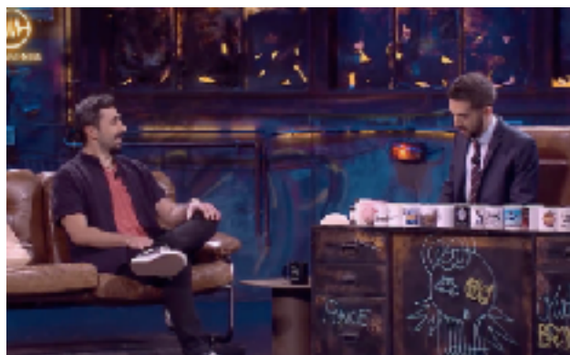
Fig 13. David Broncano entrevistando a Rayden. Fotograma del programa 02/05/2019 de La Resistencia