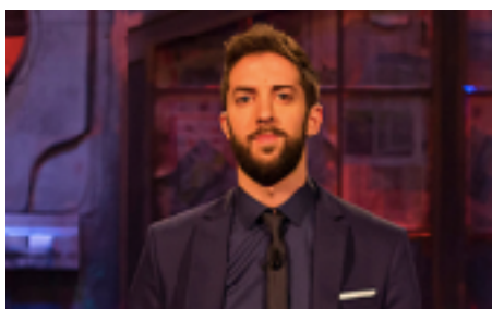
Figura 3. David Broncano, presentador de La Resistencia.

En este programa la personalidad del presentador es el hilo conductor de cada una de las secciones. Una de las características que más definen a la Resistencia es su supuesto bajo presupuesto, el cual da sensación de improvisación y frescura juvenil al programa.