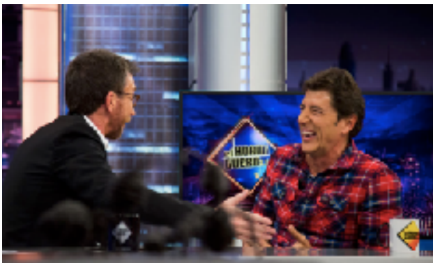
Fig 7. Pablo Motos entrevistando a Manel Fuentes. Fotograma del programa 30/04/2019 del Hormiguero