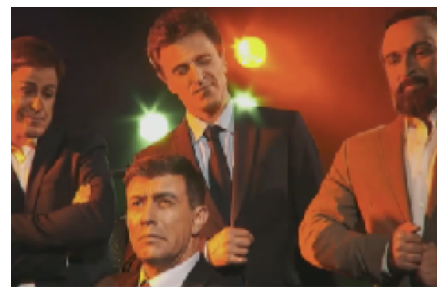
Fig 32. Parodia de Bohemian Rhapsody en la que vemos a los principales líderes políticos actuales. Fotograma del programa 02/05/2019