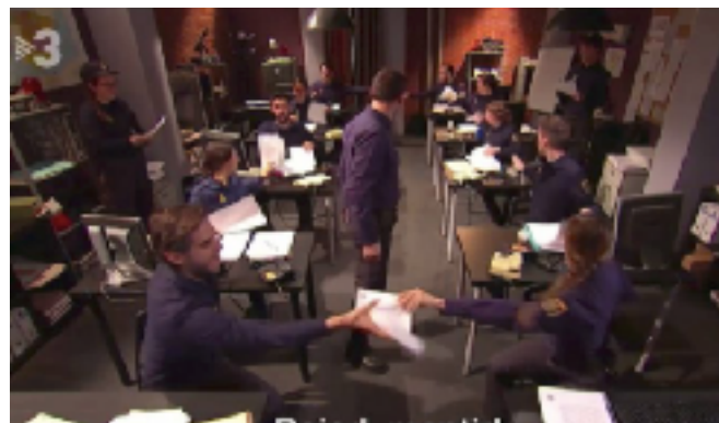
Fig 26. Escena musical sobre la corrupción del Estado. Fotograma del programa 11/04/2019 de Polònia