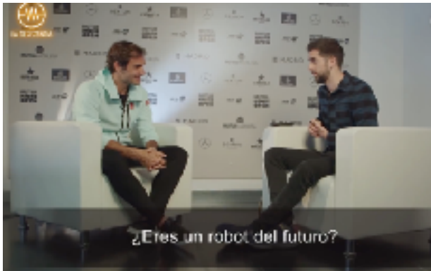
Fig 15. David Broncano entrevistando a Roger Federer. Fotograma del programa 07/05/2019 de La Resistencia