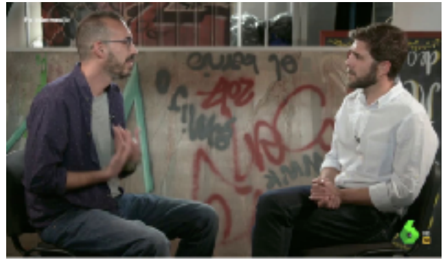
Fig 4. Gonzo entrevista a un psiquiatra para su reportaje. Fotograma del programa 02/05/2019 del Intermedio