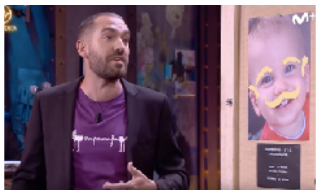
Fig 14. David Broncano entrevistando a Rayden. Fotograma del programa 02/05/2019 de La Resistencia