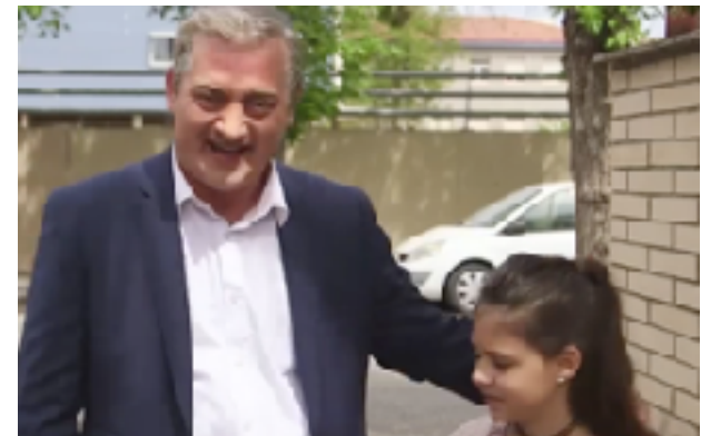
Fig 30. Gag que ridiculiza al alcalde de Coripe y, en general, a la ultraderecha española. Fotograma del programa 25/04/2019 de Polònia