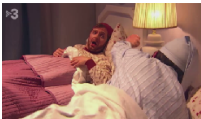
Fig 24. Comín y Puigdemont discutiendo en un gag inspirado en las escenas de Epi y Blas. Fotograma del programa 11/04/2019 de Polònia