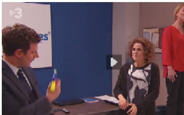
Fig 25. Escena dentro del despacho del PP tras su fracaso en las elecciones del 28 de abril. Fotograma del programa 11/04/2019 de Polònia