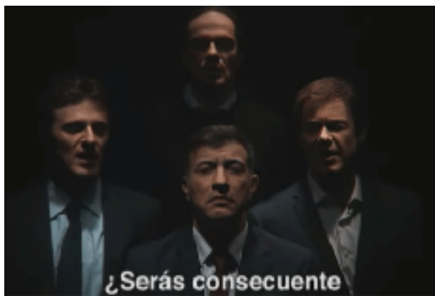
Fig 31. Gag inspirado en la canción Bohemian Rhapsody para parodiar las reacciones ante los resultados de las elecciones. Fotograma del programa 02/05/2019 de Polònia