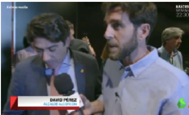
Fig 5. Gonzo entrevista al alcalde de Alcorcón. Fotograma del programa 06/05/2019 del Intermedio