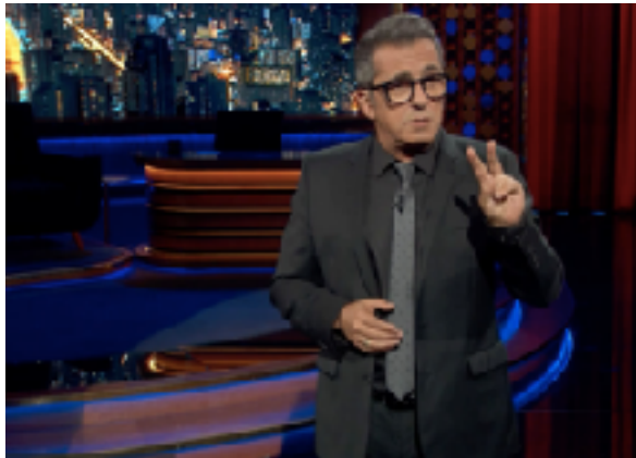
Figura 4. Andreu Buenafuente, presentador de Late Motiv.

Late Motiv, que inició sus emisiones en el año 2016 y comparte junto con La Resistencia el hecho de pertenecer a la productora El Terrat, es un late night show inspirado en formatos existentes y de popularidad contrastada estadounidenses.