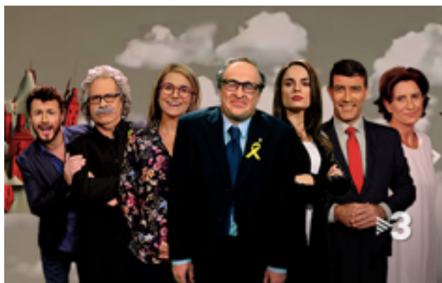
Figura 5. Algunos de los representantes políticos ficcionados en el programa Polònia, de izquierda a derecha: Gabriel Rufián, Joan Tardà, Elsa Artadi, Quim Torra, Inés Arrimadas, Pedro Sánchez y Ada Colau.

semanalmente las situaciones más polémicas que se producen en el ámbito político español.