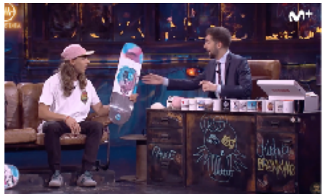
Fig 12. David Broncano entrevistando a Danny León. Fotograma del programa 30/04/2019 de La Resistencia