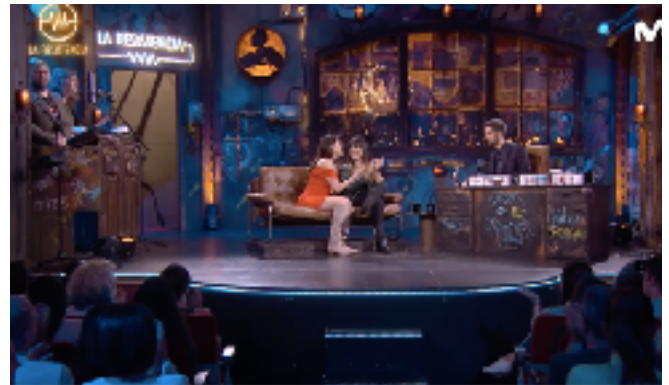
Fig 16. David Broncano entrevistando a Vanesa Martín y Adriana Ugarte. Fotograma del programa 08/05/2019 de La Resistencia