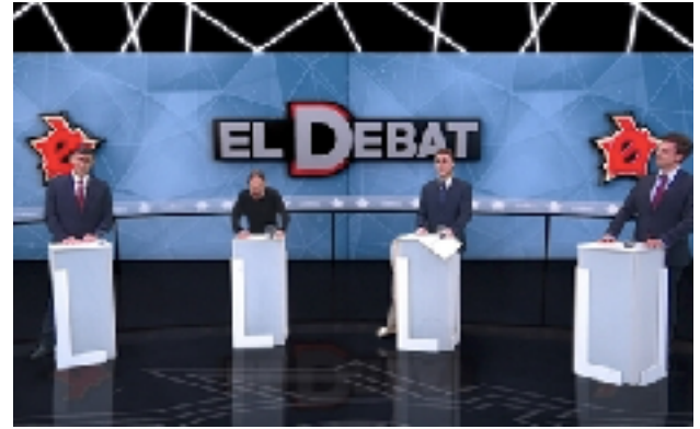
Fig 28. Gag inicial que simula uno de los debates anteriores a las elecciones del 28 de abril. Fotograma del programa 25/04/2019 de Polònia