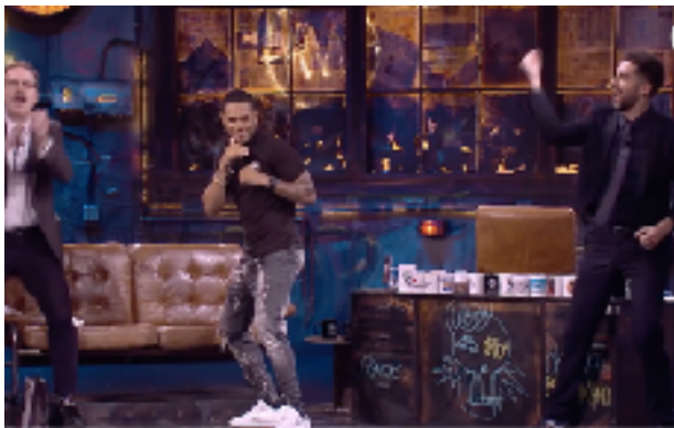
Fig 17. Jonathan Alonso junto con David Broncano, promocionando su gira de combates. Fotograma del programa 08/05/2019 de La Resistencia