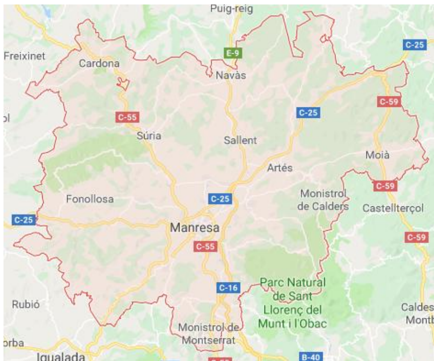
Imatge 1: Comarca del Bages amb la seva capital Manresa.

El context demogràfic en el que ocórrer el treball de camp present, es a la Catalunya central concretament a la capital del Bages, Manresa. Actualment i segons dades de l'INE l'any 2017, Manresa té una població de 75.152 habitants, dels quals, i segons IDESCAT, 11.604 habitants són migrants.