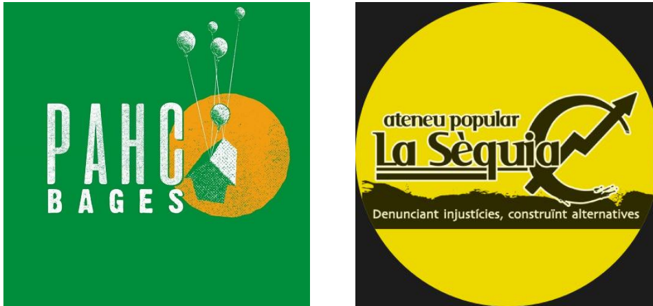
Imatge 2: Logotips actuals de la PAHC Bages i l'Ateneu Popular la Sèquia.

Una d'aquestes es troba al Bages a la seva capital Manresa i funciona de forma molt activa des del 2012. Aquesta es va formar a partir de l'apadrinatge de la PAHC de Sabadell i des de sempre es troba a l'Ateneu Popular la Sèquia, que és un Centre Social Okupat de la ciutat que es regeix per ser un espai anticapitalista, feminista i antifeixista, tot creant alternatives. Les PAHC i PAH del territori català a dia d'avui ja han aturat més de 2045 desnonaments.