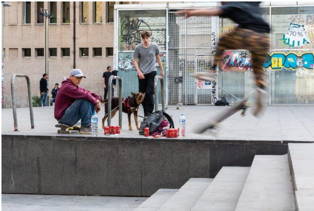
Imagen 14: escaleras que conectan la zona inferior con la plaza. Skaters y cervezas.