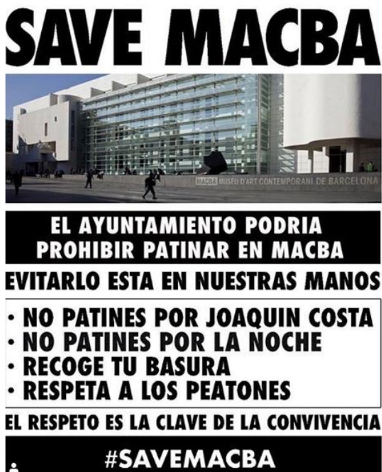
Imagen 9: cartel realizado por MacbaLife