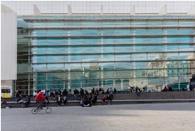
Imagen 15: tomar asiento