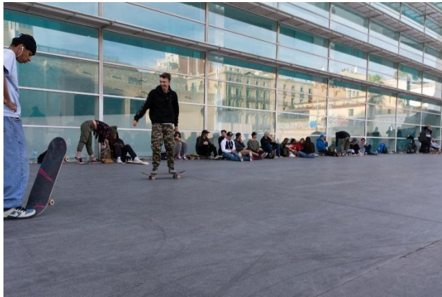
Imagen 10: una tarde de marzo. Parte superior de la plaza.

“Perdonad, ¿os podéis apartad? Hoy es el único día que el museo está cerrado y queremos practicar para grabar una cosa. Gracias” (Un skater a los senegaleses) 47 .