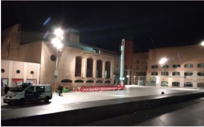
Imagen 4: miércoles 30 de enero, 23h.