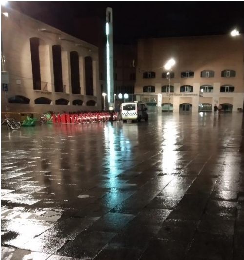
Imagen 5: miércoles 30 de enero, 00.49h. Tras pasar el personal de limpieza