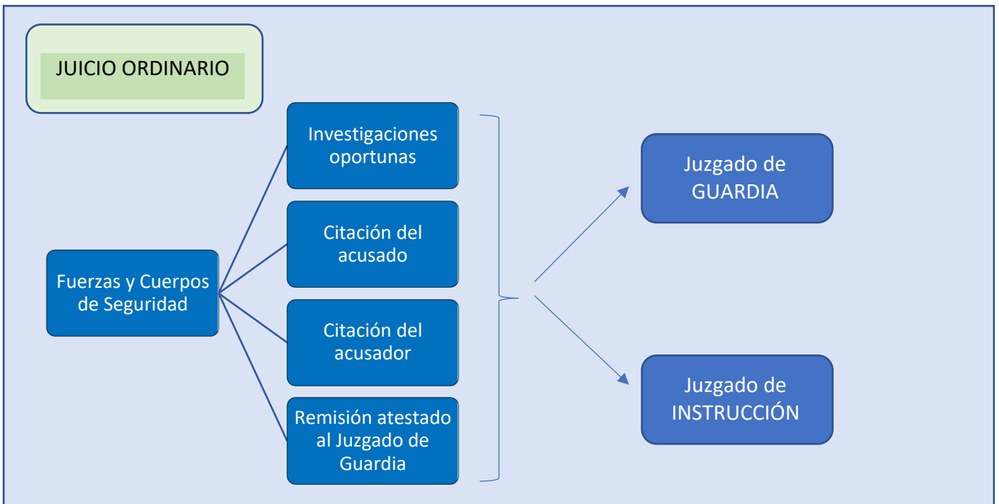
Esquema de creación propia