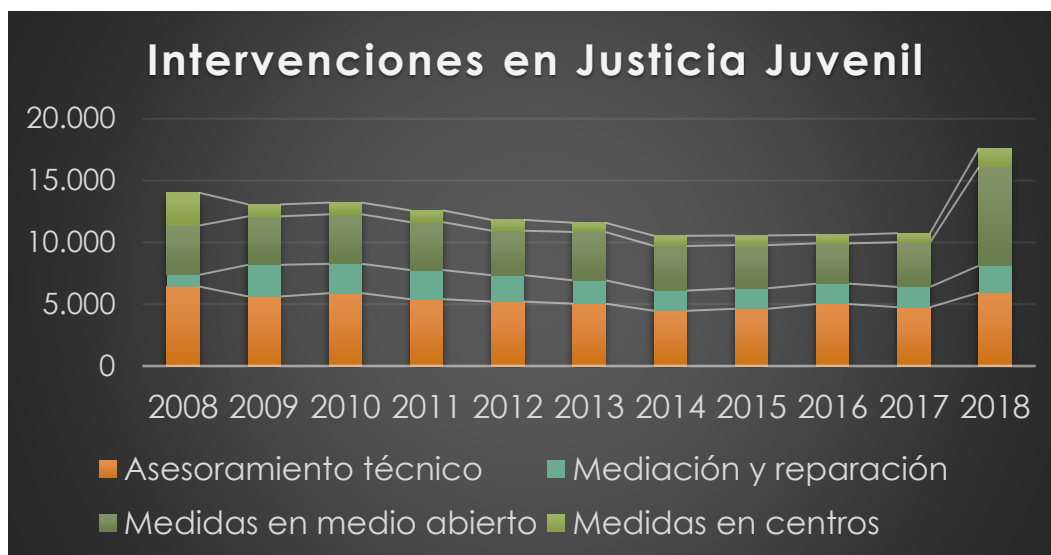
Gráfico 1. Intervenciones con menores (14-18 años) por tipos de asistencia en Cataluña.