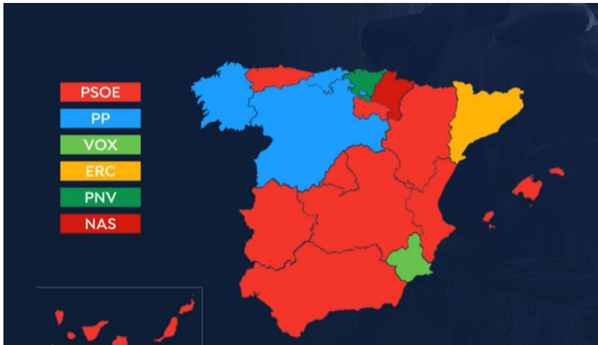
Resultats eleccions generals per comunitats, 10/11/2019.

A partir del règim instaurat el 1978, la política espanyola es va establir amb un sistema bipartidista. El PSOE i el PP s'anaven turnant el poder, però les conjuntures de la darrera dècada han dissolt aquest patró. Factors com la crisi econòmica del 2008, la pujada de l'ultradreta a Europa, el 15-M i el conflicte català han transformat l'esfera pública i llurs suports electorals: l'opinió pública es veu significativament modificada, amb menys conscienciació ideològica, ergo menys compromís i afiliacions partidistes, i amb un vot menys fidel i més volàtil a causa del desconcert social. La superficialitat informativa, especialment en política, i la complexitat del sistema a nivell polític, econòmic i social formen un panorama que desorienta cada cop més l'electorat. Aquesta mateixa incomprensió de la realitat és la que contribueix a mantenir un taulell polític tan inestable. Per tant, grosso modo , podríem dir que la mediatització de la política ha provocat una pèrdua qualitativa d'aquesta davant de les futures eleccions, ja que ni els partits defensen una ideologia tan clara ni l'electorat se sent tan identificat amb una facció concreta. Per aquest motiu,