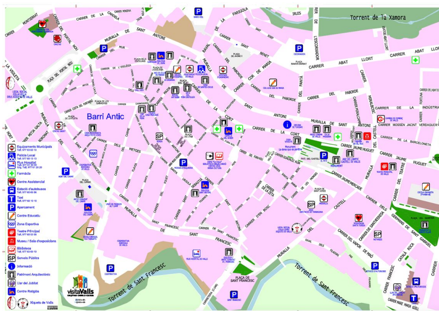
Plànol del Barri Antic de Valls.