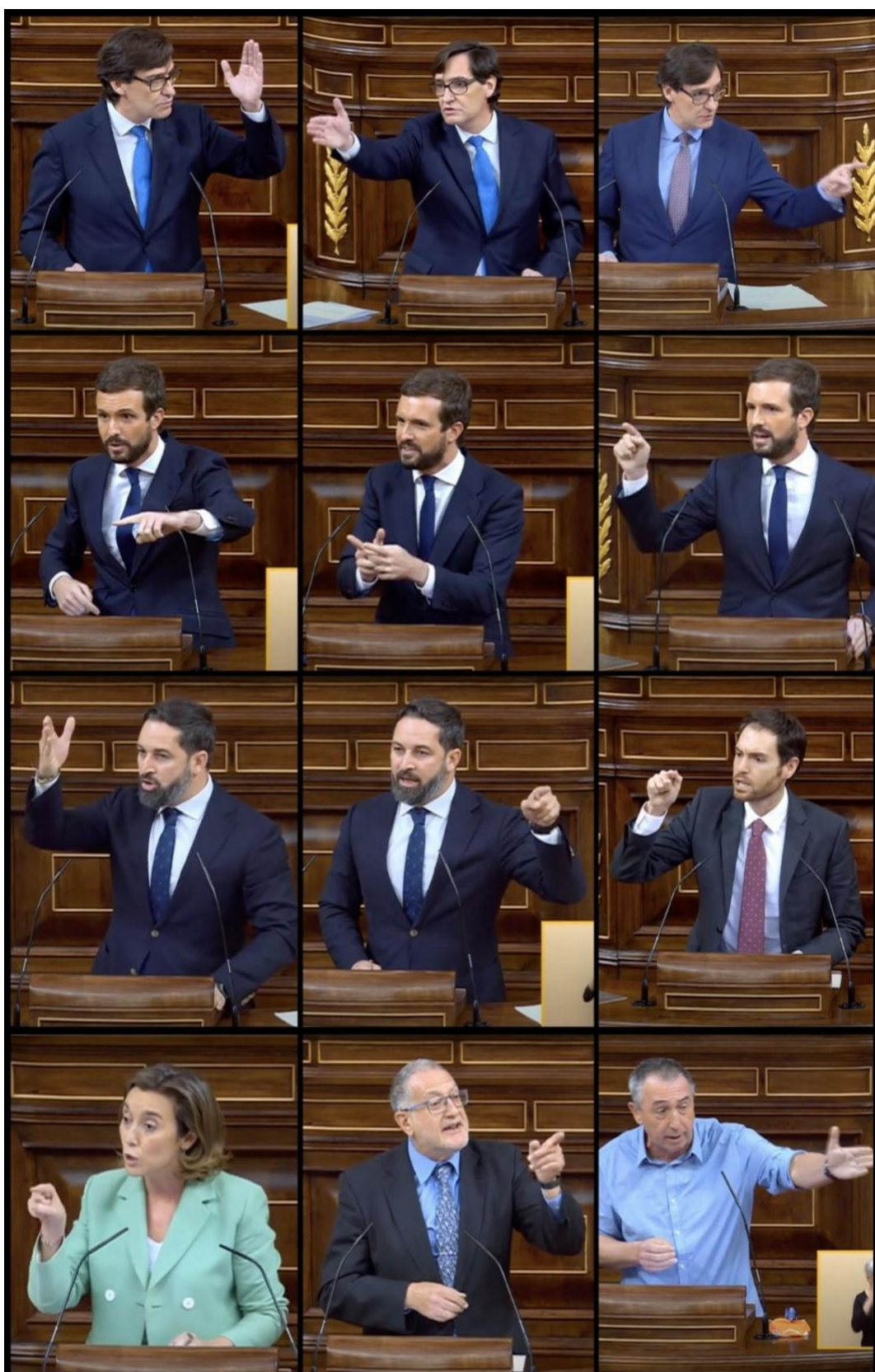
Il·lustració 14 Diputats assenyalant durant els debats d'estats d'alarma de la segona onada a l'hemicicle del Congrés dels Diputats.