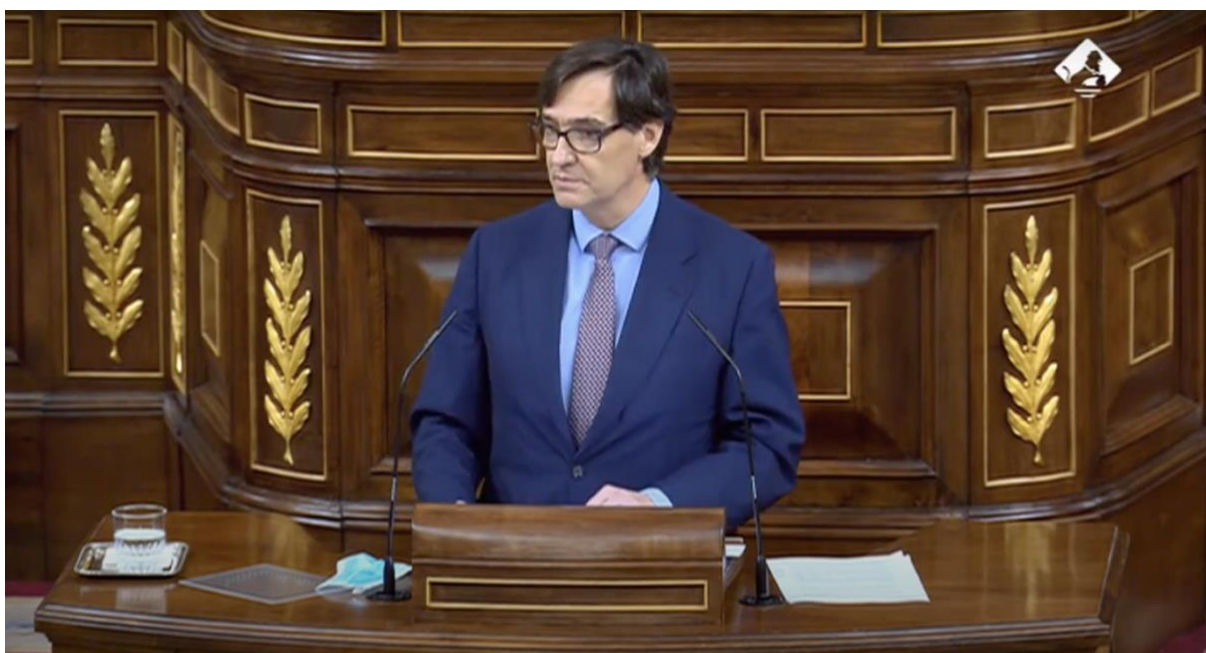
Il·lustració 7 Salvador Illa durant el primer debat d'estat d'alarma el 15 d'octubre a l'hemicicle del Congrés dels Diputats.

Per entrar a mostrar els resultats obtinguts en els dos debats d'estats d'alarma: 15 d'octubre i 29 d'octubre, s'ha de tenir en compte el context.