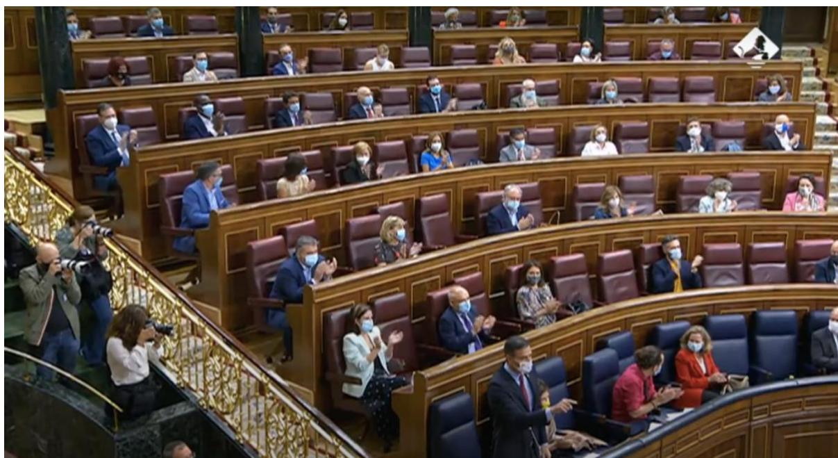
Il·lustració 2 Pedro Sánchez parlant en una sessió de control al Congrés dels Diputats

Abans de procedir a exposar els resultats dels discursos analitzats a les sessions de control que es troben als Annexos del treball, és necessari comprendre en què consisteix aquesta activitat parlamentària.