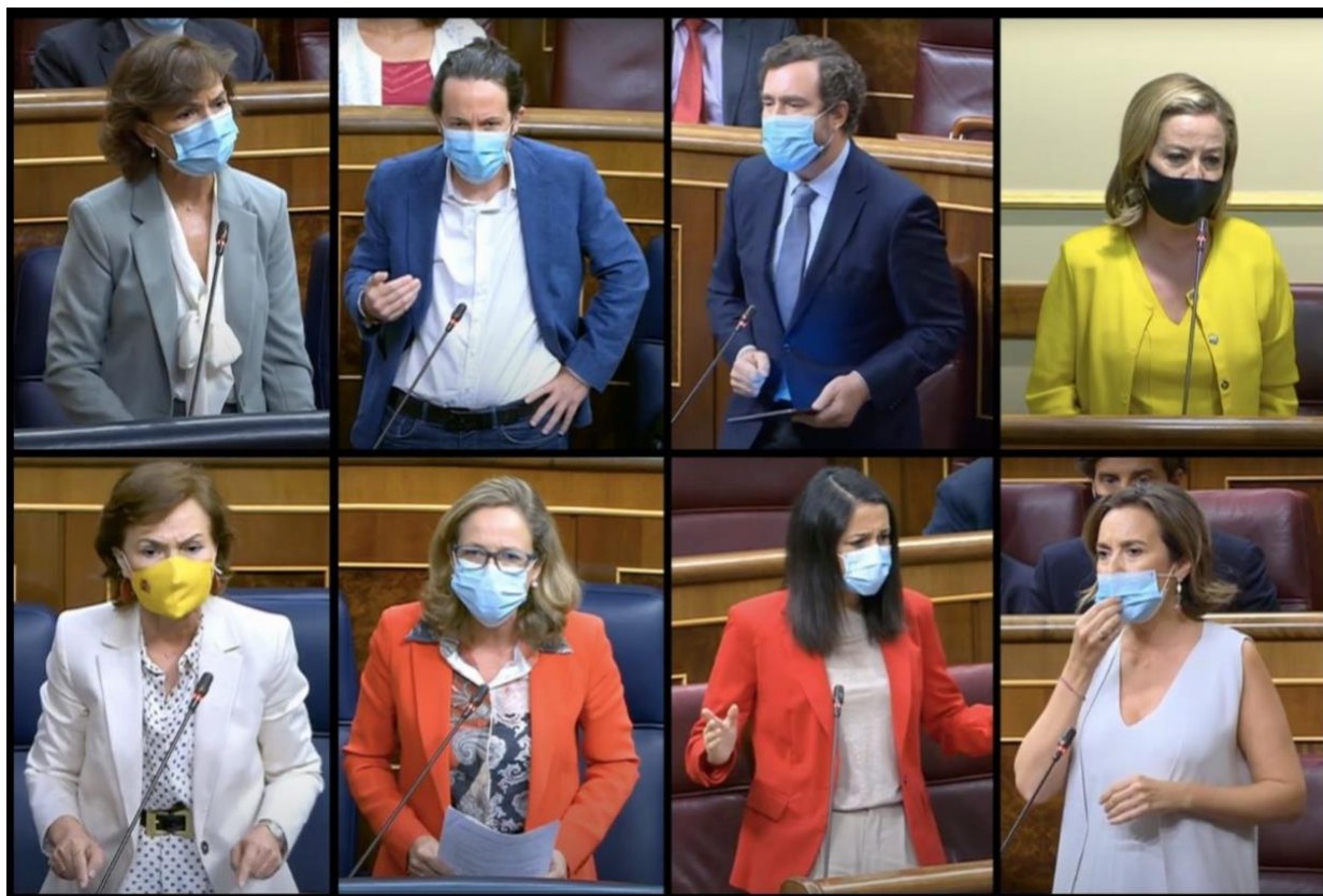
Il·lustració 11 Diputats arrufant les celles durant les sessions de control de la segona onada a l'hemicicle del Congrés dels Diputats.

A més, en certs moments han arrufat les celles i el nas, sobretot quan la situació s'ha tensat més. Per Herrarte i Rodríguez Escanciano (2009), aquest gest té un significat persuasiu negatiu, ja que mostra agressivitat, una actitud d'estar a la defensiva i desaprovació.