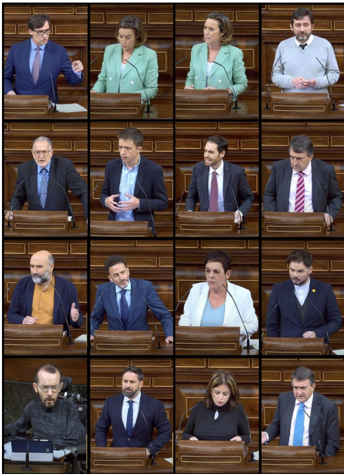
Il·lustració 12 Diputats arrufant les cel·les durant els debats de l'estat d'alarma de la segona onada a l'hemicicle del Congrés de Diputats.