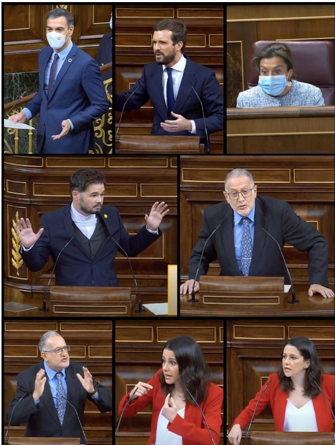
Il·lustració 15 Diputats fent gestos exagerats durant la segona onada a l'hemicicle del Congrés dels Diputats.

A més, alguns polítics tendeixen a exagerar el llenguatge no verbal fent gestos molt dramatitzats.