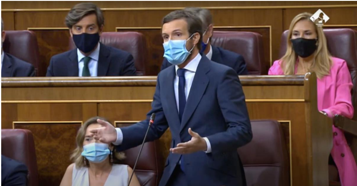
Il·lustració 8 Pablo Casado parlant durant una sessió de control a l'hemicicle del Congrés dels Diputats dels Diputats