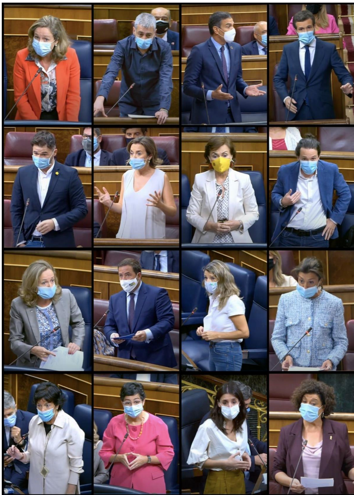
Il·lustració 9 Diputats aixecant les celles durant les sessions de control de la segona onada a l'hemicicle del Congrés dels Diputats.