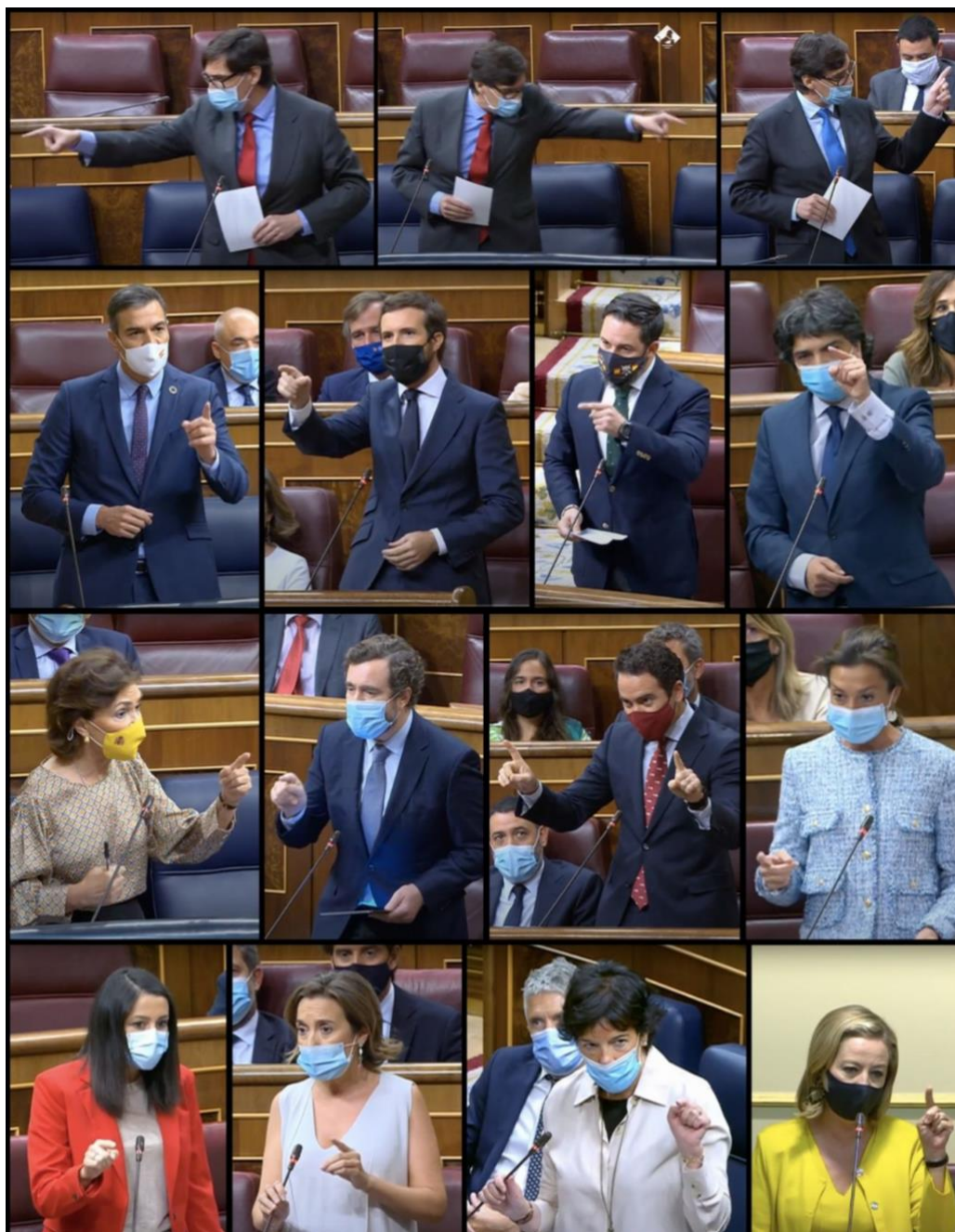
Il·lustració 13 Diputats assenyalant durant les sessions de control de la segona onada a l'hemicicle del Congrés dels Diputats.

El moviment que més realitzen amb les mans i els dits és el d'assenyalar, en molts casos per culpar, el qual els grups parlamentaris de VOX i del PP ho han utilitzat exageradament. Segons Herrarte i Rodríguez Escanciano (2009) és un gest que se sol utilitzar per mostrar actituds agressives i poden ser amenaçadors, sent en certs moments neutres però en gran part gestos molt negatius.