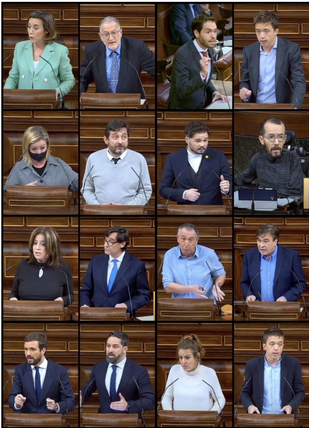
Il·lustració 10 Diputats aixecant les cel·les durant els debats d'estat d'alarma de la segona onada a l'hemicicle del Congrés dels Diputats.