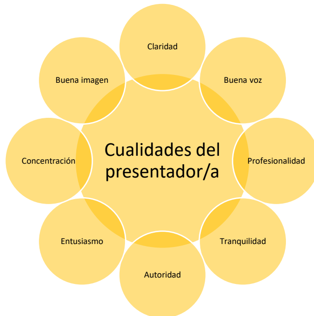
Figura 4. Cualidades del presentador de informativos

sí que hay unas cualidades necesarias para la presentación de programas en televisión.