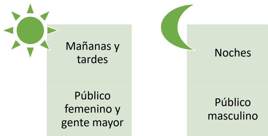
Figura 3: Target del magazín

Mónica Gómez Martín comenta que una de las características que diferencia al magazín de los otros géneros es el target, ya que, según los audímetros, y en lo que se refiere a targets según sexo, “en los horarios matinales y de tarde, es el público femenino el que más ve la televisión. Por el contrario, en los horarios de noche, después del “prime time”, es el público masculino el mayoritario” (Gómez Martín, 2005: 1). En Argentina, por ejemplo, consideran que este tipo de programas, al estar instalado en una franja horaria que va de 9 a 13 horas, la mayoría de los espectadores son, por lo general, “mujeres amas de casa, gente mayor y en muy menor medida, chicos que asisten de tarde al colegio” (Godano Silvana, 2015: 2)