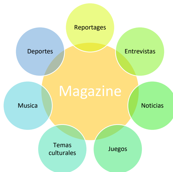
Figura 2: Composición del magazín

Por tanto, el magazín es un género muy heterogéneo ya que en su interior hay un gran abanico de géneros como el reportaje, la entrevista, el debate, juegos, paneles, los informativos, temas culturales, musicales, deportivos, etcétera.