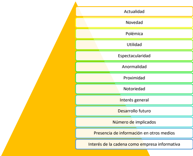
Figura 5. Valores de la noticia

sigue un criterio concreto. Siendo consideradas (por orden de importancia) los siguientes valores los que hacen que una noticia sea incluida en la parte informativa.