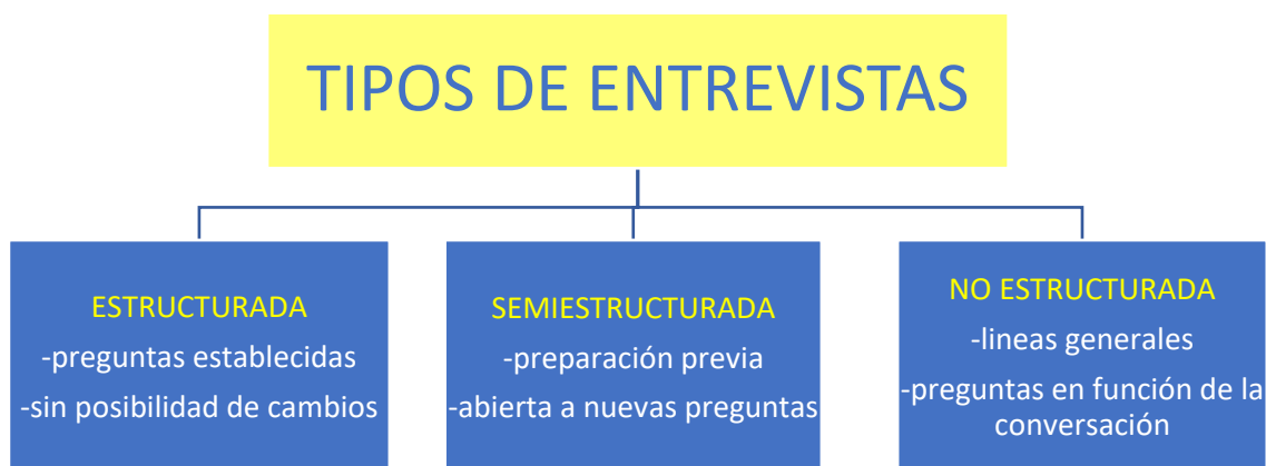
Figura 6. Tipos de entrevista

Dentro de la familia de entrevistas cualitativas se encuentran tres tipos: las de formato estructurado, las de semiestructurado y las no estructuradas. Las primeras se caracterizan por tener sus elementos, es decir las preguntas, establecidos antes de hacer la entrevista, y que, por tanto, no sufren cambios posteriormente. El segundo tipo contiene una preparación y estructura previa, pero el entrevistador puede incluir preguntas oportunas si la situación lo requiere.