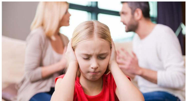
Acostuma a ser difícil que les parelles immerses en divorcis conflictius preservin als menors d'aquesta conflictivitat

Al voltant de 10.000 parelles amb fills i filles es van divorciar de manera conflictiva durant l'any 2019 a Espanya. A causa de divorcis conflictius, els menors es veuen privats de diferents aspectes, com l'atenció o l'afecte, que són molt importants pel seu desenvolupament. Alguns estudis assenyalen els divorcis conflictius com un factor de risc que pot generar l'aparició i cronificació de comportaments perjudicials pels menors, en quant al seu desenvolupament psicològic i emocional, i també la seva adaptació a la realitat.